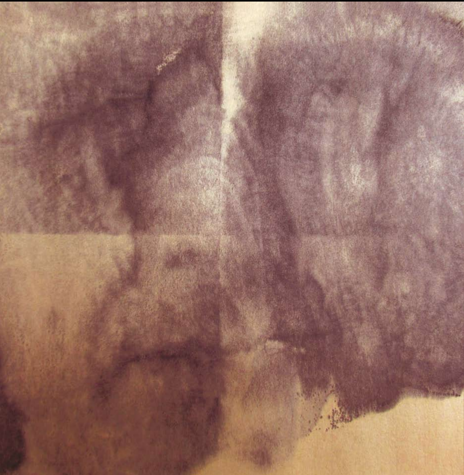
KWADRYPTYK z cyklu ALIENACJA, 2022, technika mieszana na papierze, 20 x 20 cm. QUADRIPTYCH from the cycle ALIENATION, 2022, mixed technique on paper, 20 x 20 cm.