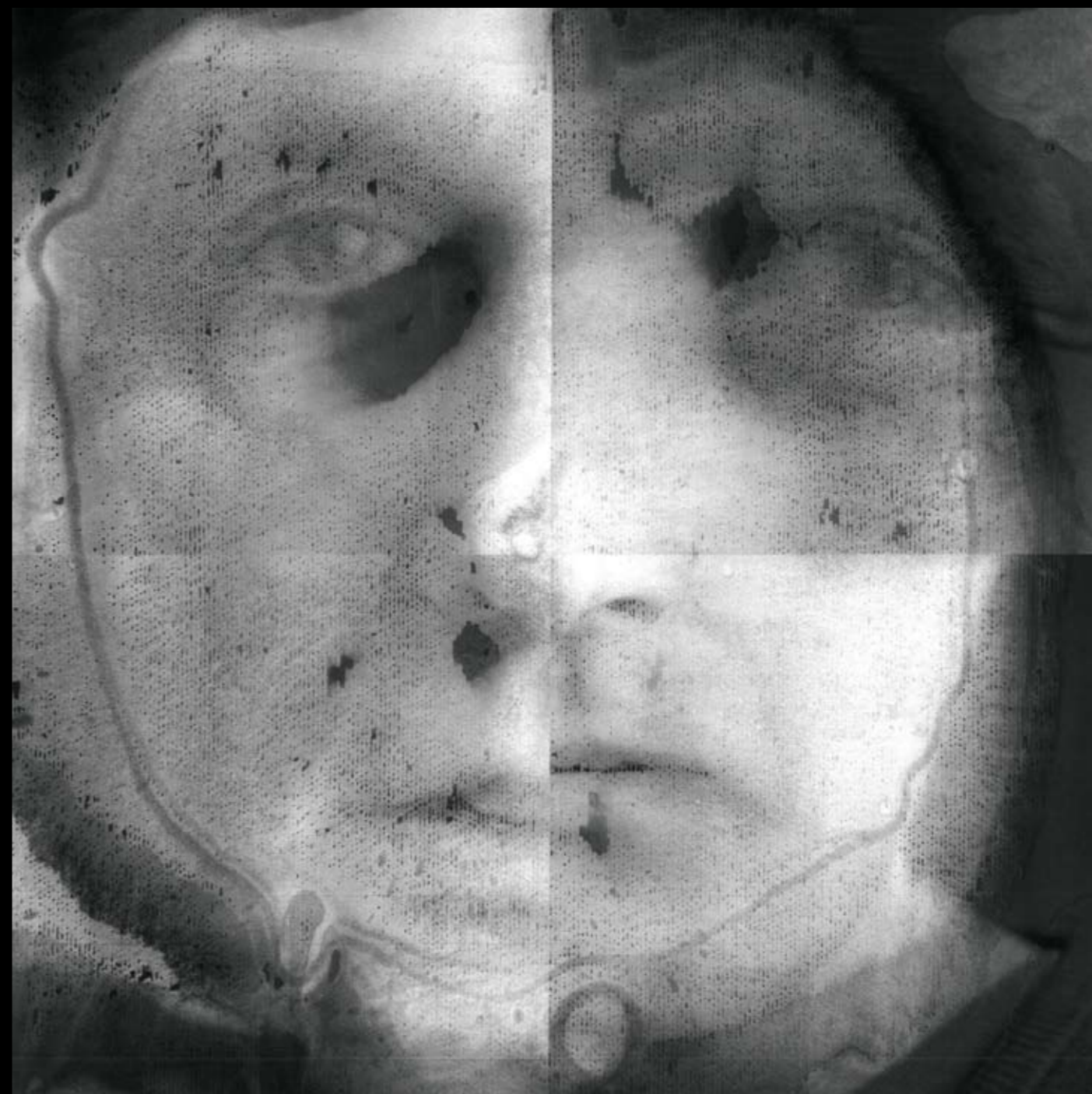
NIEMOC z cyklu ALIENACJA , 2021, technika mieszana POWERLESSNESS from the cycle ALIENATION , 2021, mixed technique