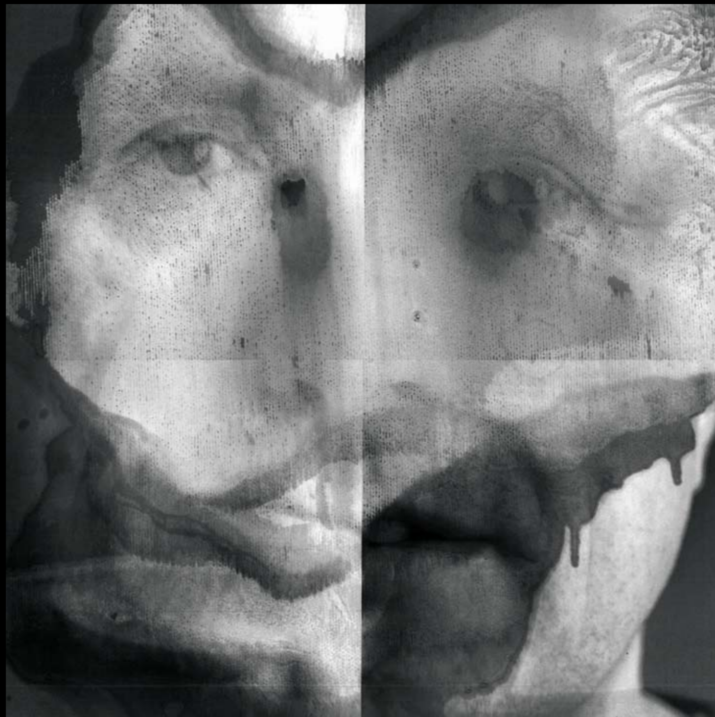
METAMORFOZY , 2020, technika mieszana na szkle, 48 x 48 cm. METAMORPHOSES , 2020, mixed technique on glass, 48 x 48 cm.