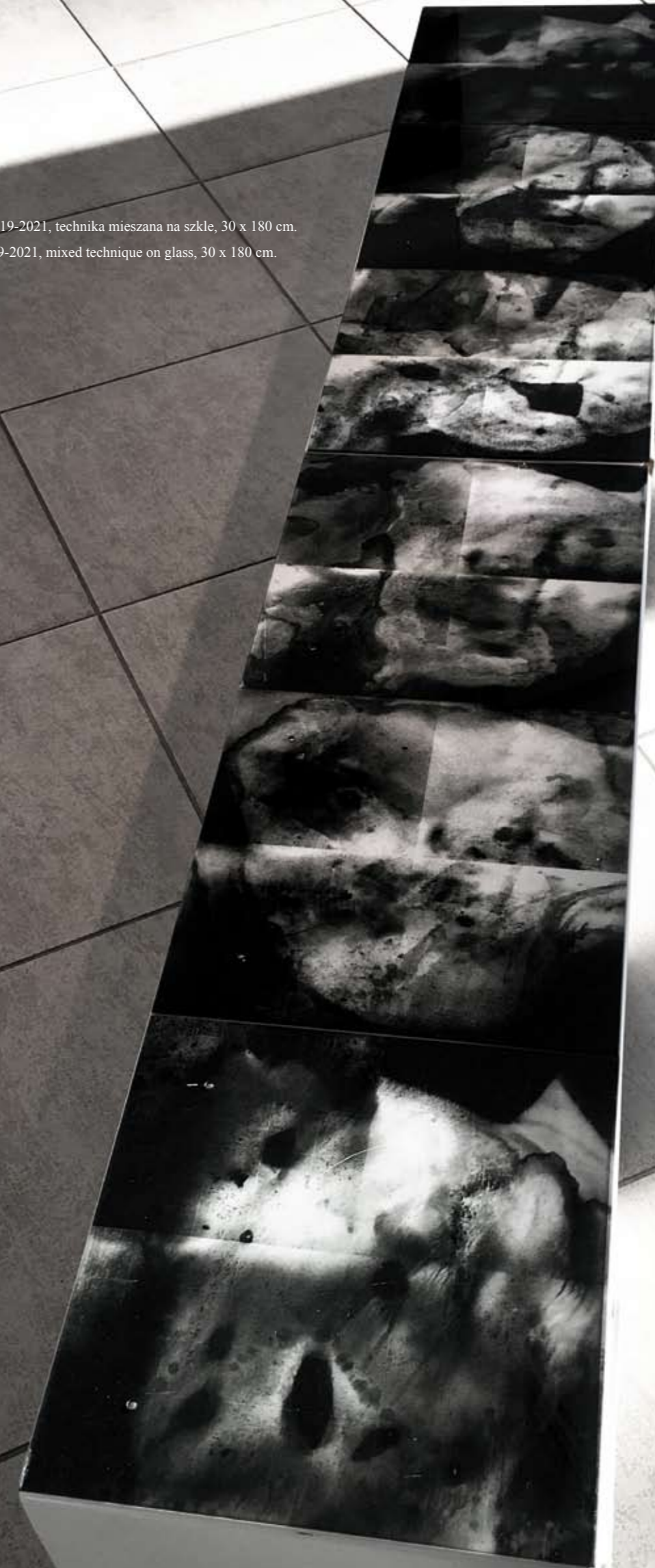
Cycle LAYERS , 2019-2021, mixed technique on glass, 30 x 180 cm.