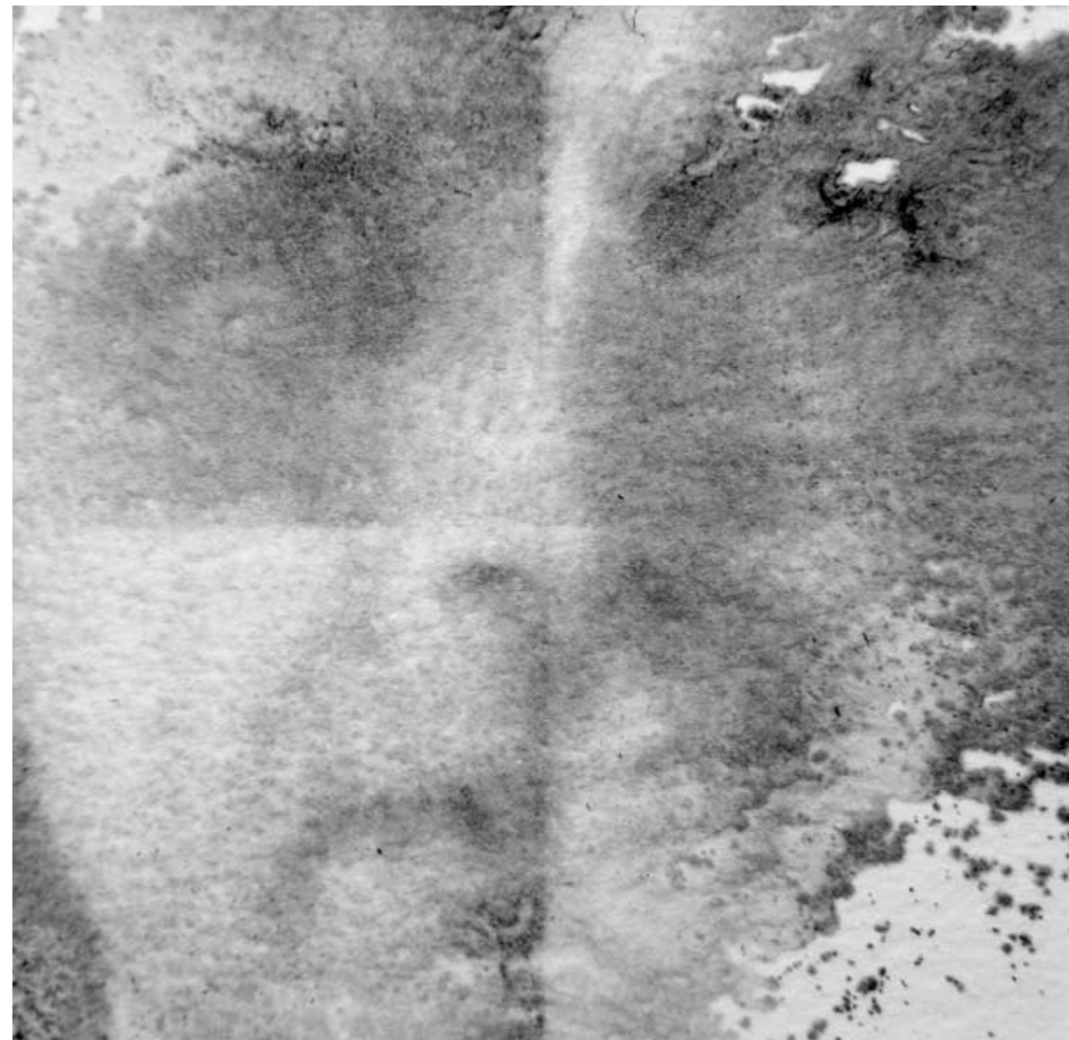
KWADRYPTYK z cyklu ALIENACJA, 2022, technika mieszana na papierze, 2 x 10 x 10 cm. QUADRIPTYCH from the cycle ALIENATION, 2022, mixed technique on paper, 2 x 10 x 10 cm.