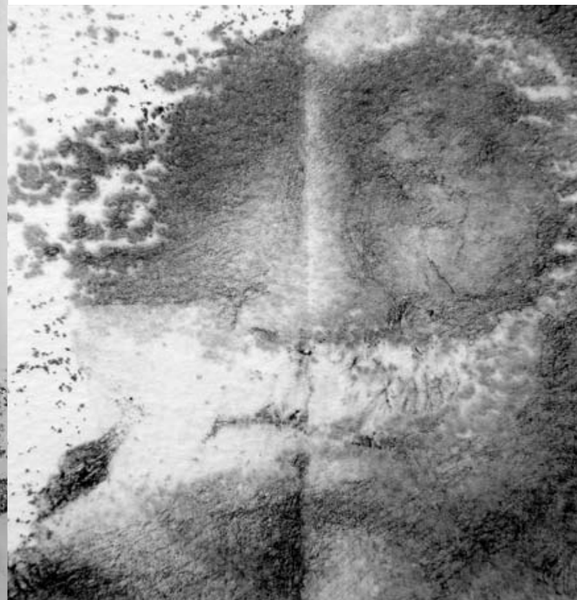
Cykl ALIENACJA , 2021, technika mieszana na papierze, 40 x 40 cm. Cycle ALIENATION , 2021, mixed technique on paper, 40 x 40 cm.