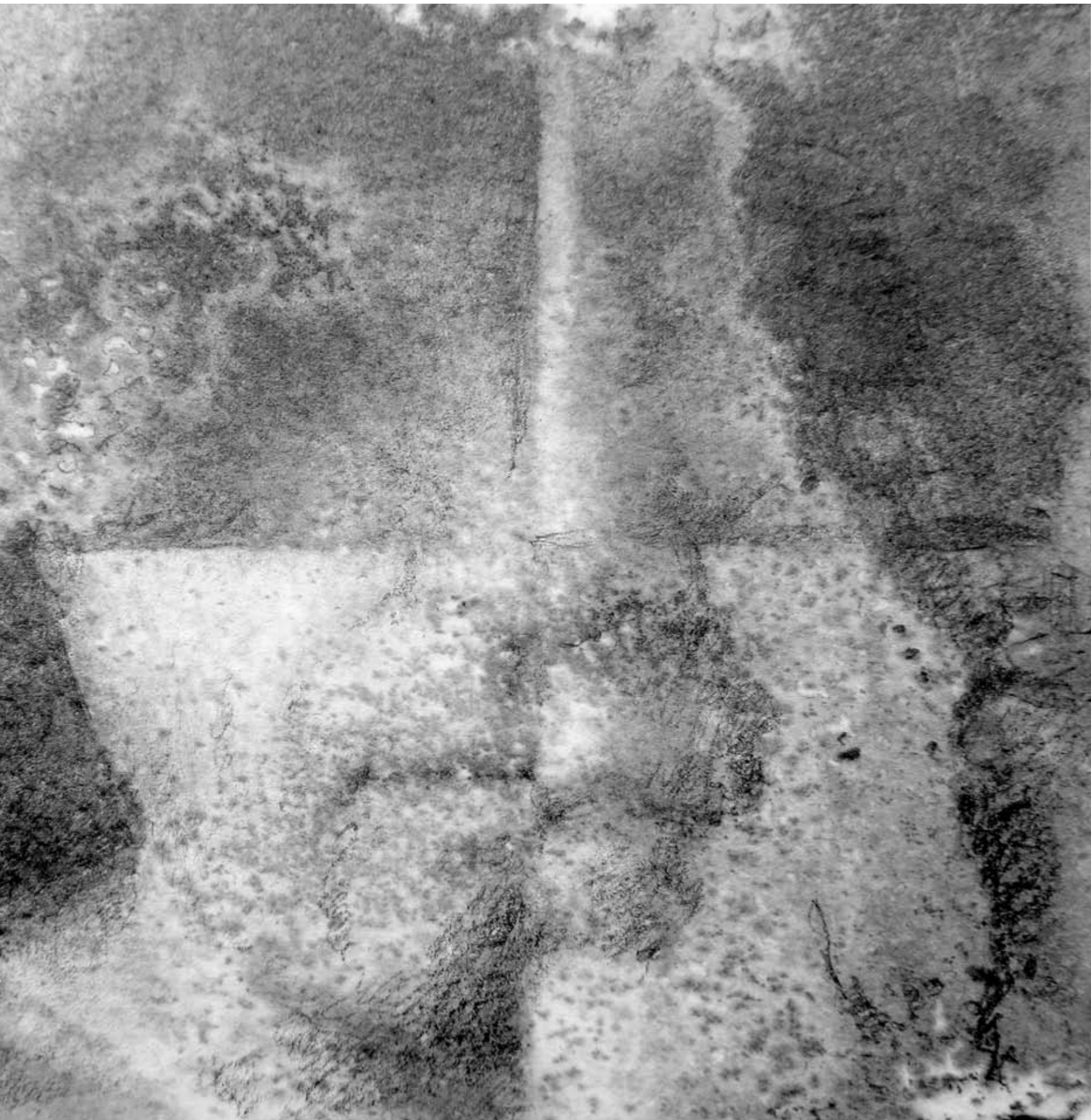
Cykl ALIENACJA , 2022, technika mieszana na papierze, 10 x 10 cm. Cycle ALIENATION , 2022, mixed technique on paper, 10 x 10 cm.