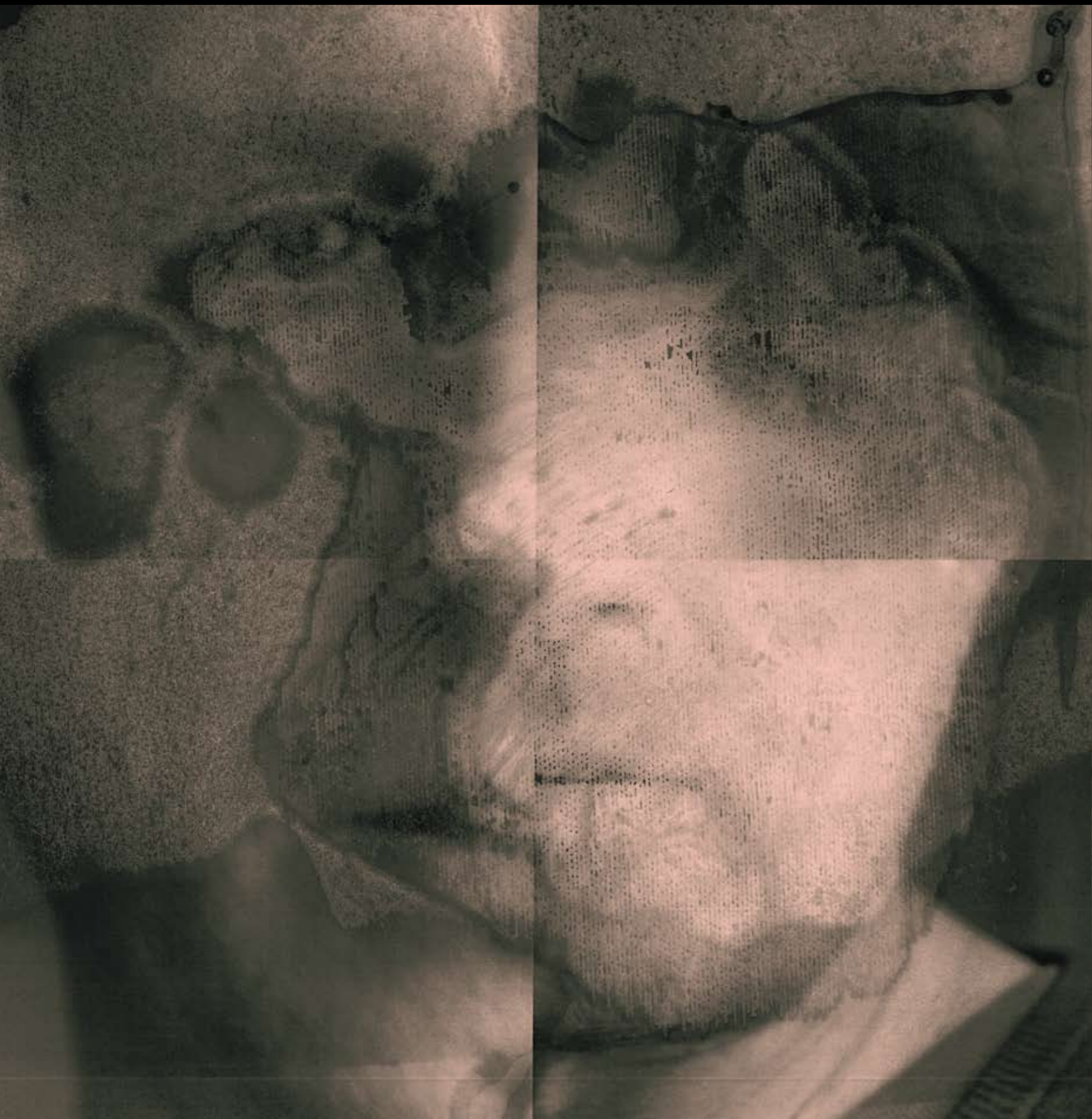
Cykl POWŁOKI , 2020, technika mieszana na szkle, 48 x 48 cm. / Cycle LAYERS , 2020, mixed technique on glass, 48 x 48 cm.