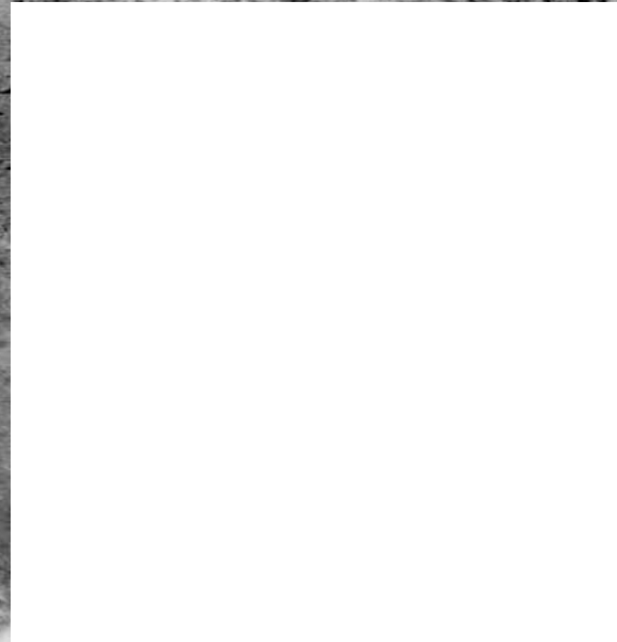
Cykl ALIENACJA , 2022, technika mieszana na papierze, 2 x 10 x 10 cm. Cycle ALIENATION , 2022, mixed technique on paper, 2 x 10 x 10 cm.