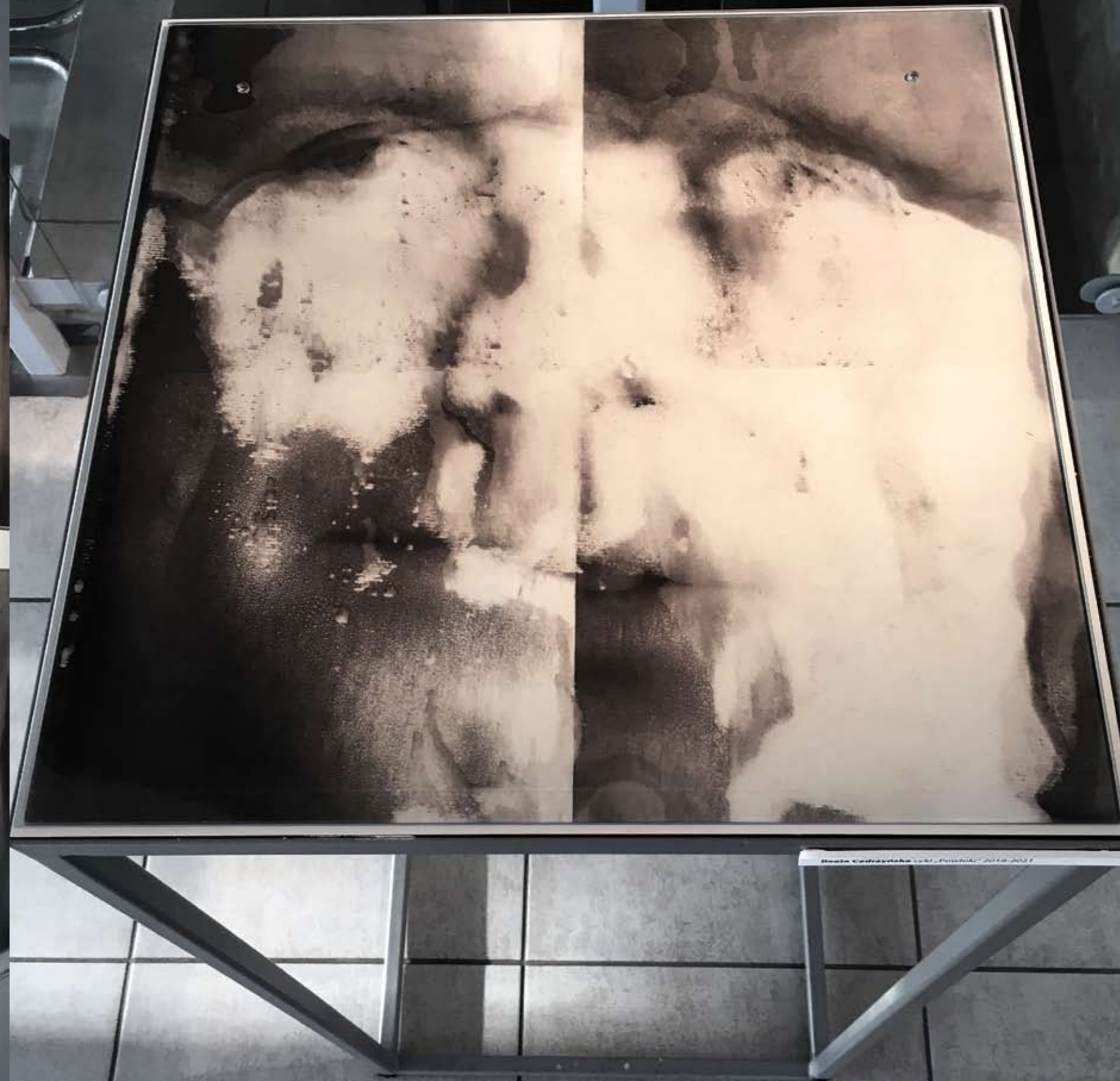
METAMORFOZY , 2020, technika mieszana na szkle, 48 x 48 cm. (każdy) METAMORPHOSES , 2020, mixed technique on glass, 48 x 48 cm. (each)