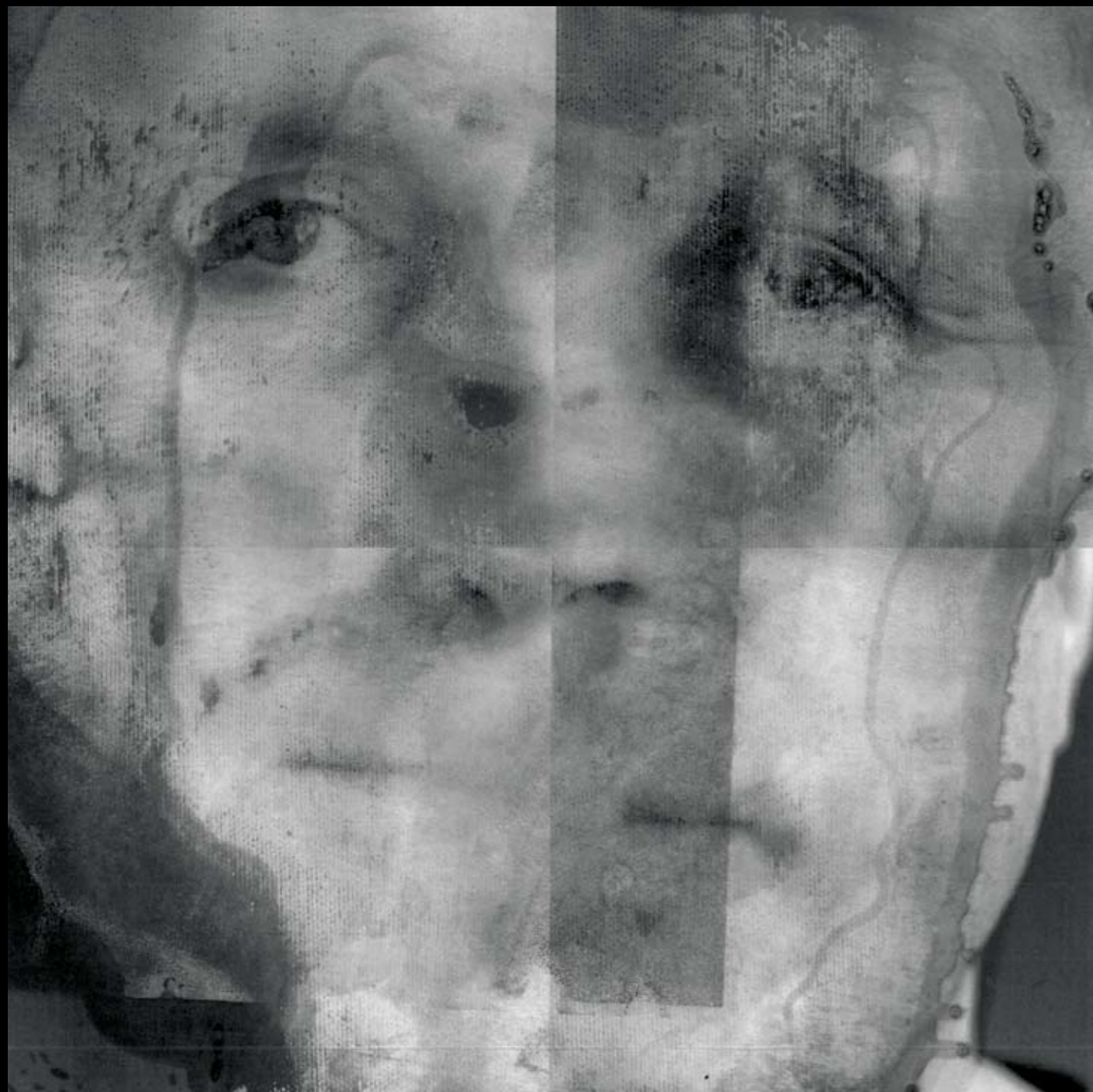
METAMORFOZY , 2020, technika mieszana na szkle, 48 x 48 cm. METAMORPHOSES , 2020, mixed technique on glass, 48 x 48 cm.