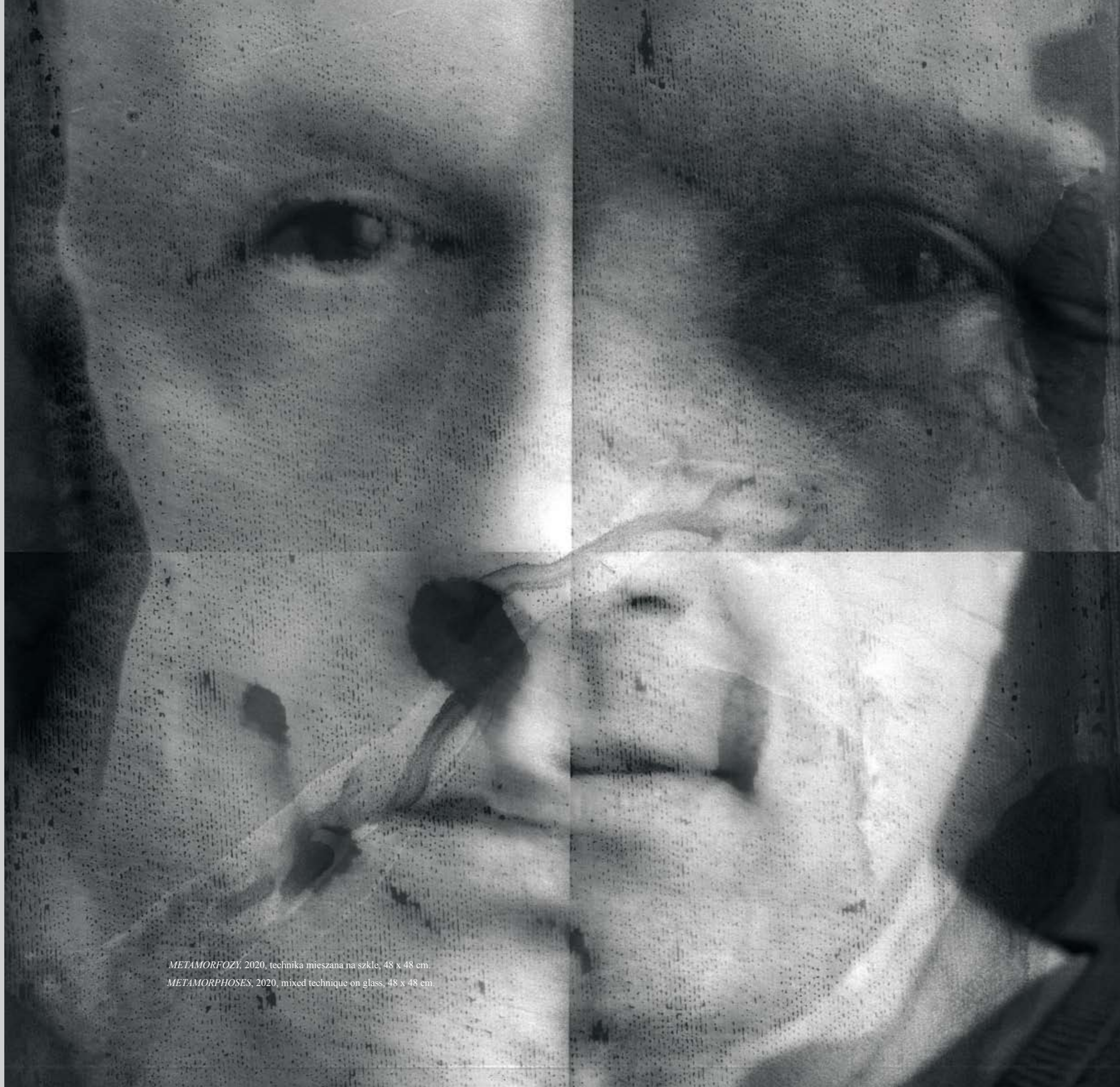
METAMORFOZY , 2020, technika mieszana na szkle, 48 x 48 cm. METAMORPHOSES , 2020, mixed technique on glass, 48 x 48 cm.