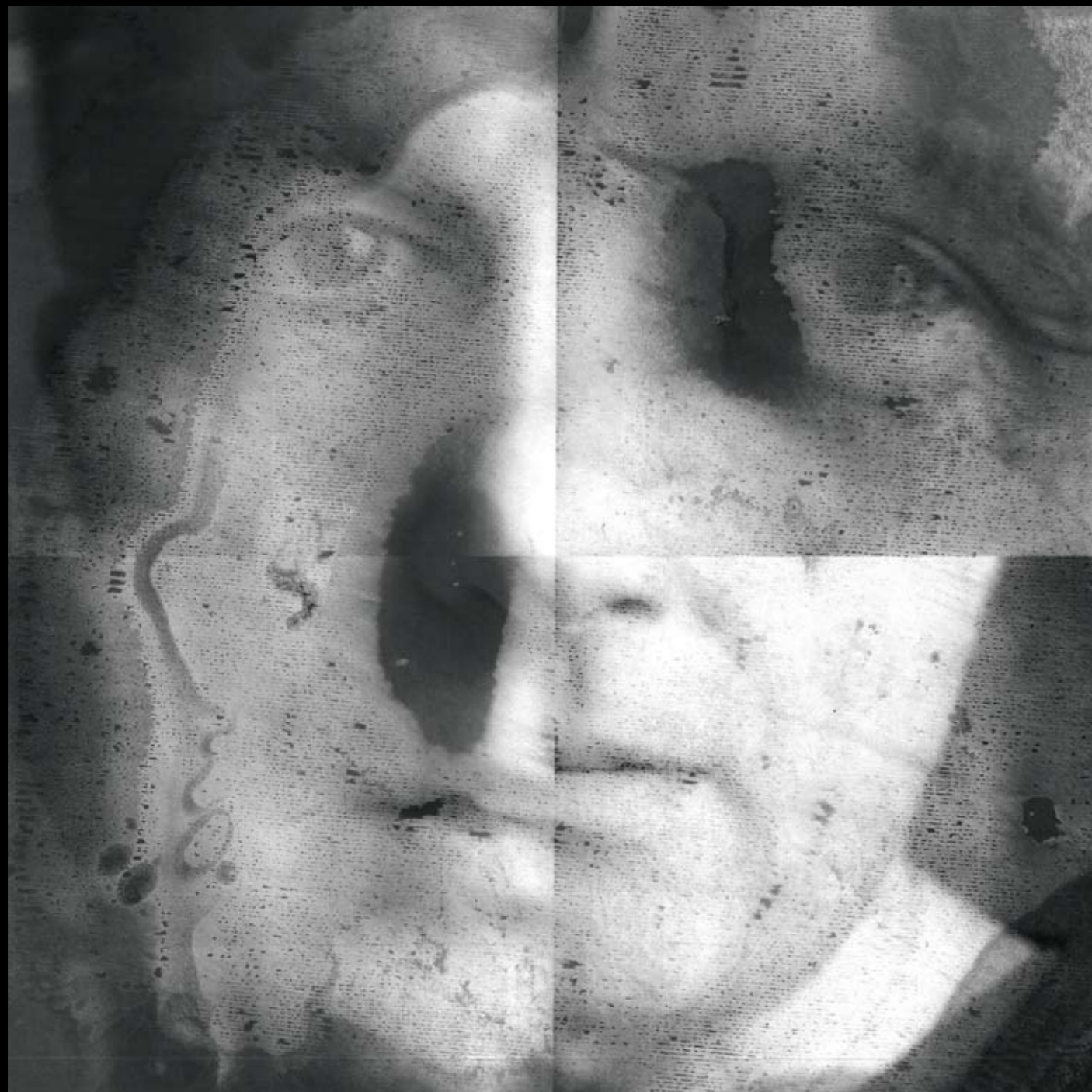
METAMORFOZY , 2020, technika mieszana na szkle, 48 x 48 cm. METAMORPHOSES , 2020, mixed technique on glass, 48 x 48 cm.