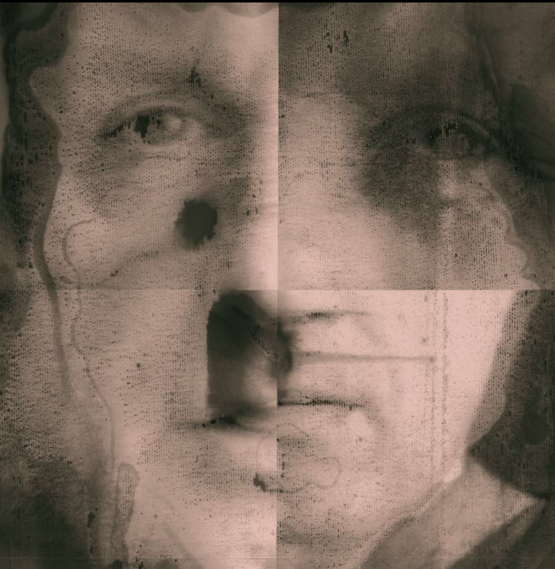
Cykl POWŁOKI , 2020, technika mieszana na szkle, 48 x 48 cm. / Cycle LAYERS , 2020, mixed technique on glass, 48 x 48 cm.