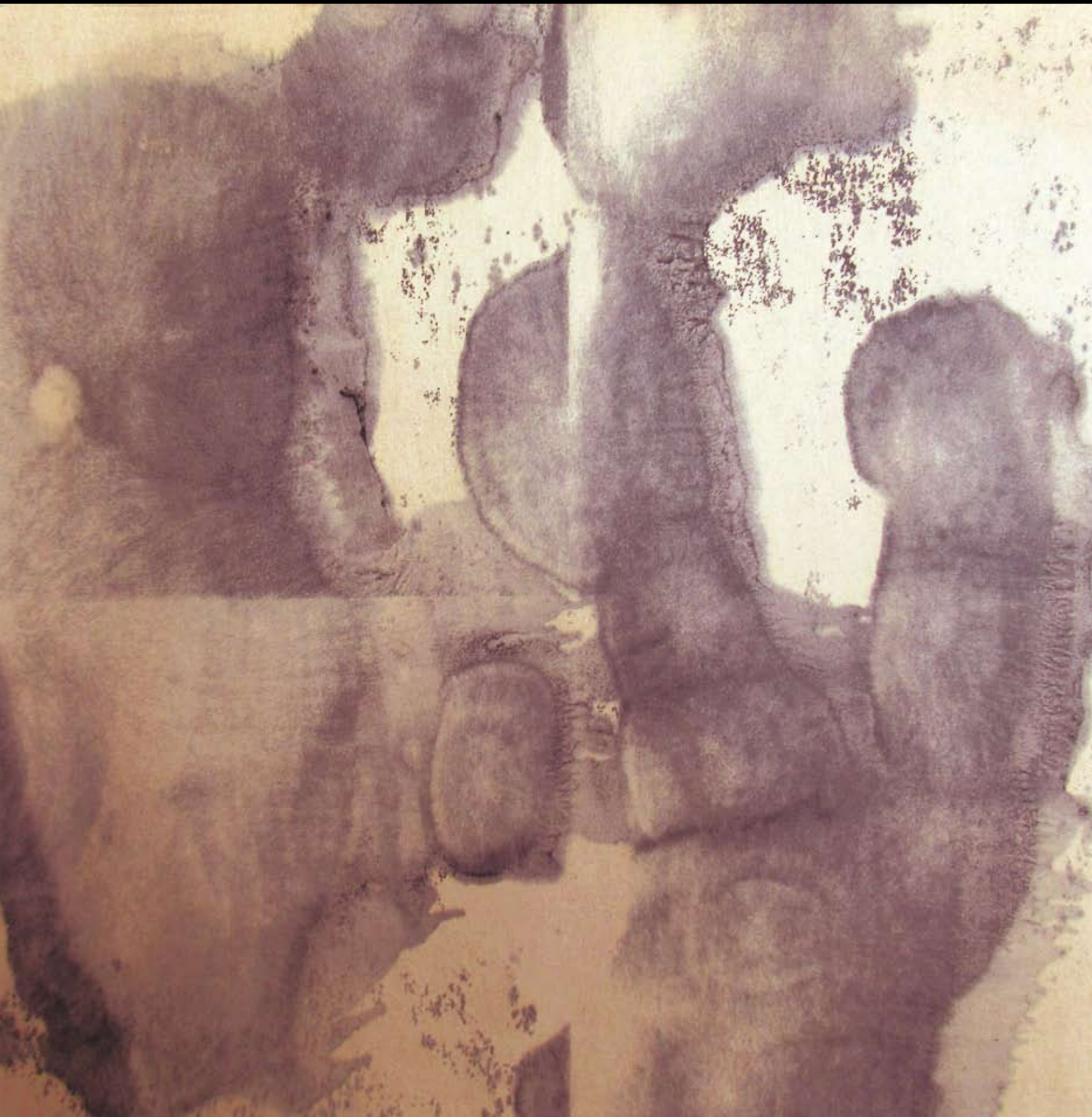
KWADRYPTYK z cyklu ALIENACJA, 2022, technika mieszana na papierze, 20 x 20 cm. QUADRIPTYCH from the cycle ALIENATION, 2022, mixed technique on paper, 20 x 20 cm.