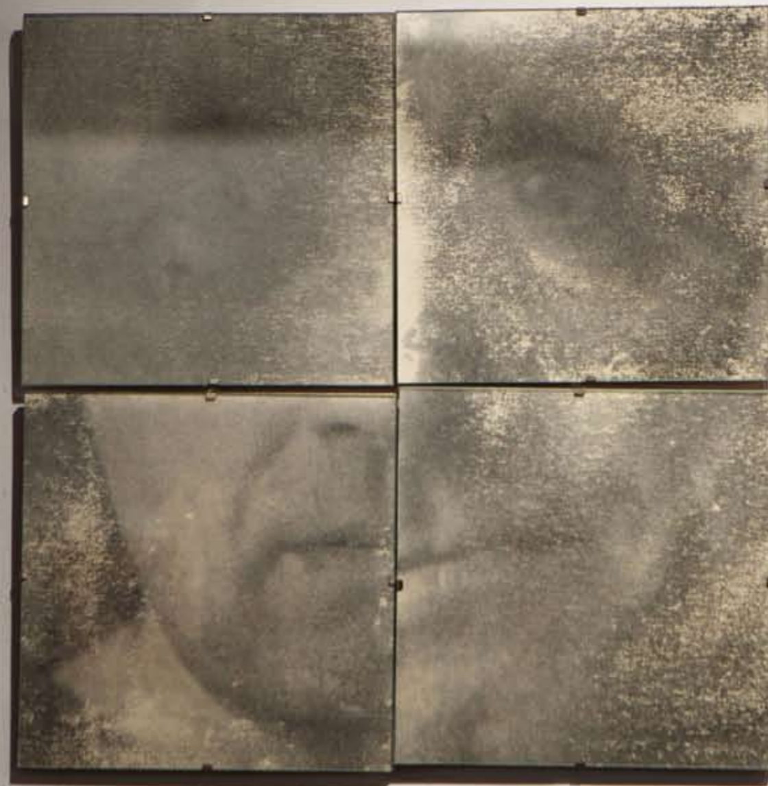
Kwadroptyk III, z cyklu OUTSIDER, 2016, technika mieszana, 40 x 40 cm. Quadriptych III, from the cycle OUTSIDER, 2016, mixed technique, 40 x 40 cm.