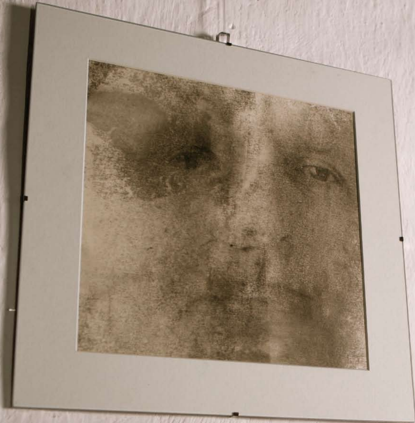
Galeria „REFEKTARZ”, Kartuzy „REFEKTARZ” Gallery, Kartuzy