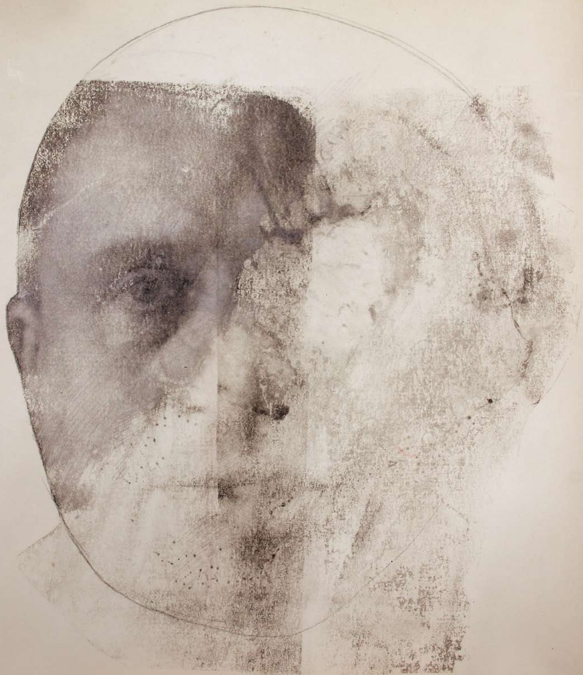
„OUT II”, z cyklu OUTSIDER , 2016, technika mieszana, 50 x 50 cm. „OUT II”, from the cycle OUTSIDER , 2016, mixed technique, 50 x 50 cm.