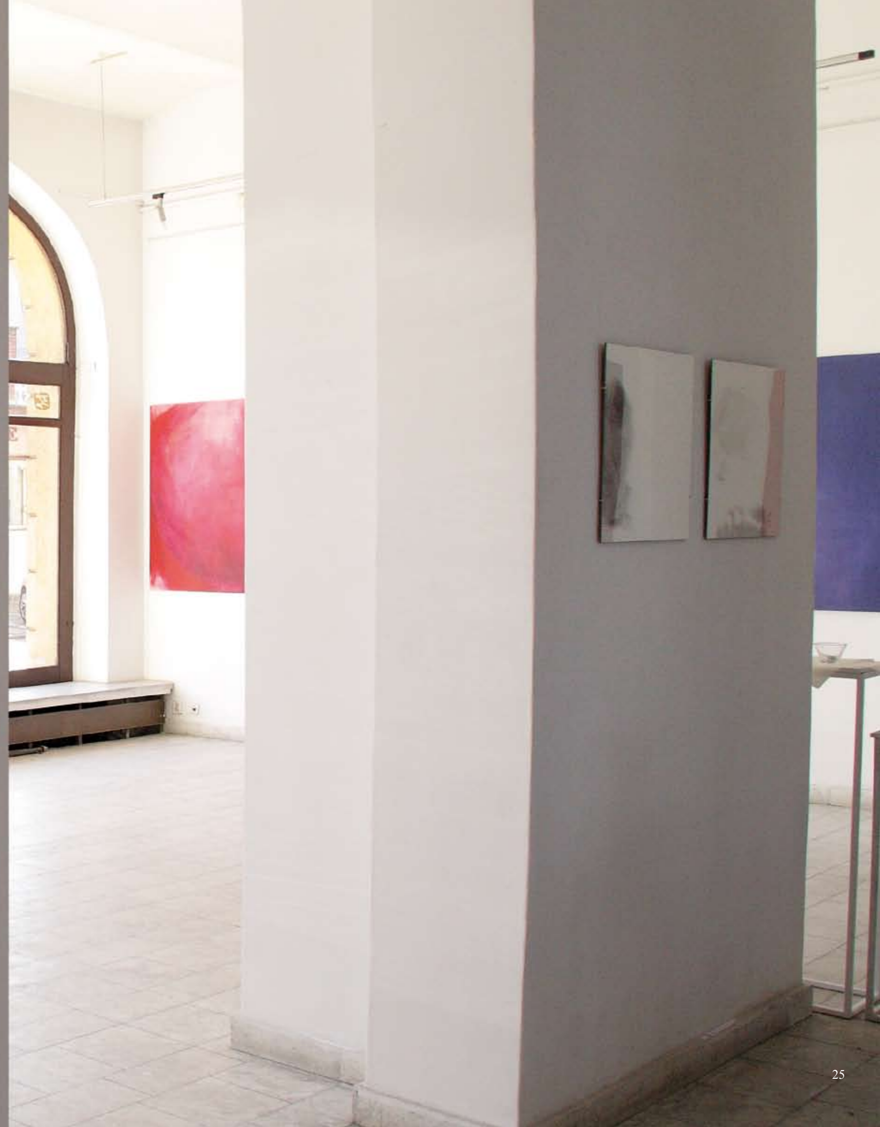
Galeria ZPAP „Kierat 1”, Szczecin ZPAP Gallery „Kierat 1”, Szczecin