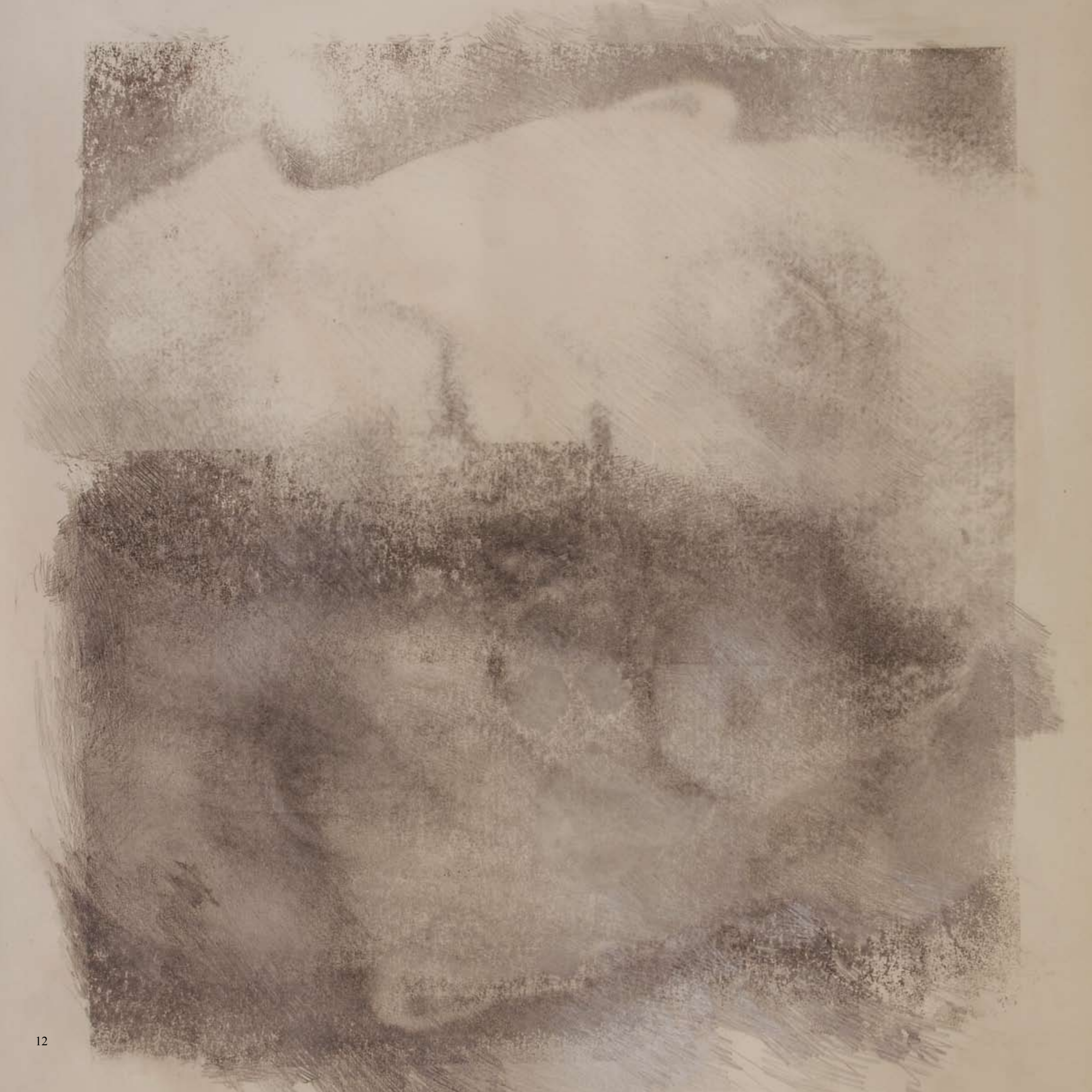
„OUT III”, z cyklu OUTSIDER , 2016, technika mieszana, 50 x 50 cm. „OUT III”, from the cycle OUTSIDER , 2016, mixed technique, 50 x 50 cm.