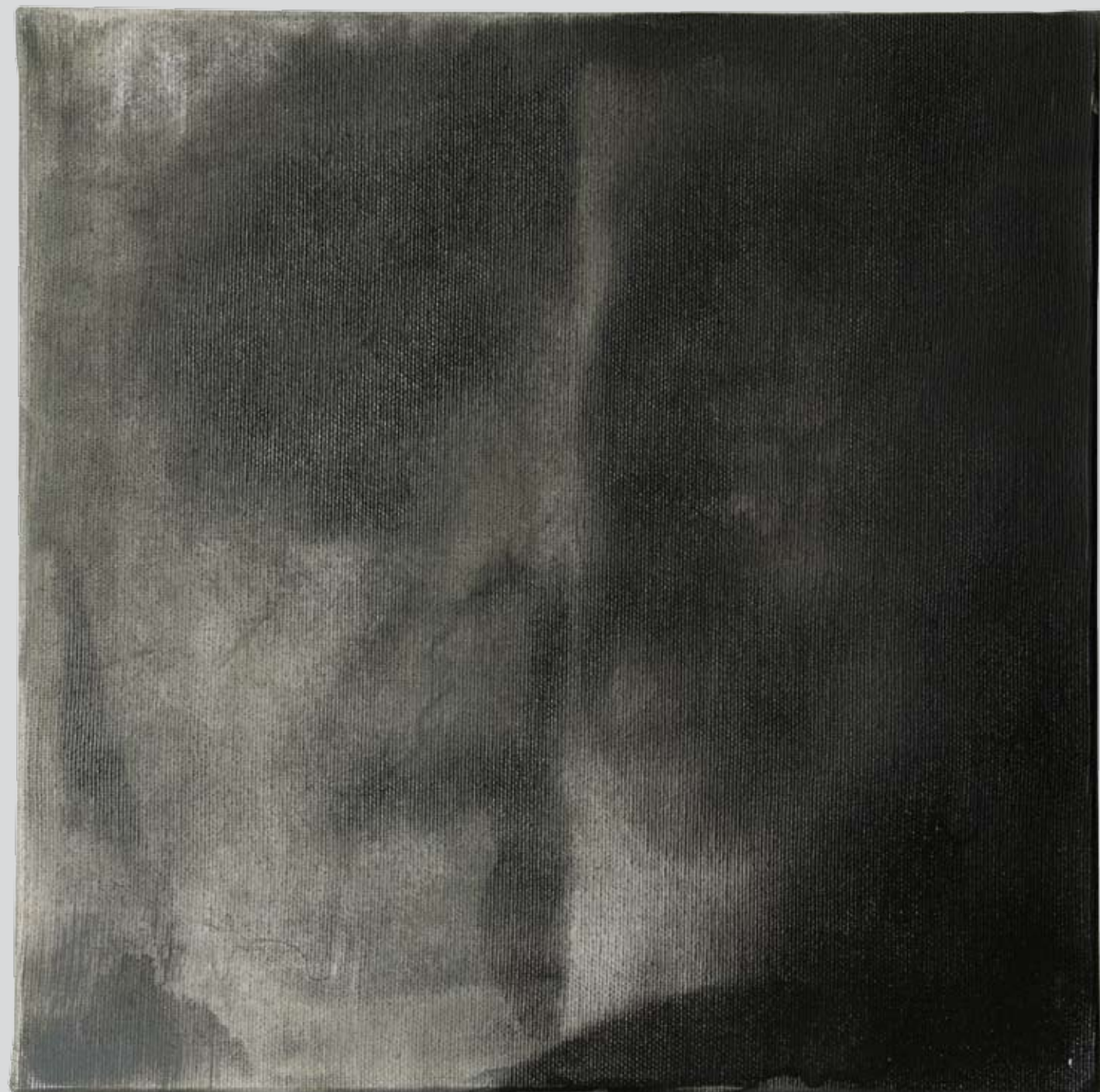
„Nienazwane” z cyklu „Ciało i sacrum”, 2018, technika mieszana na płótnie, 30 x 30 cm. “Unnamed” from the cycle “Body and sacrum”, 2018, mixed technique on canvas, 30 x 30 cm