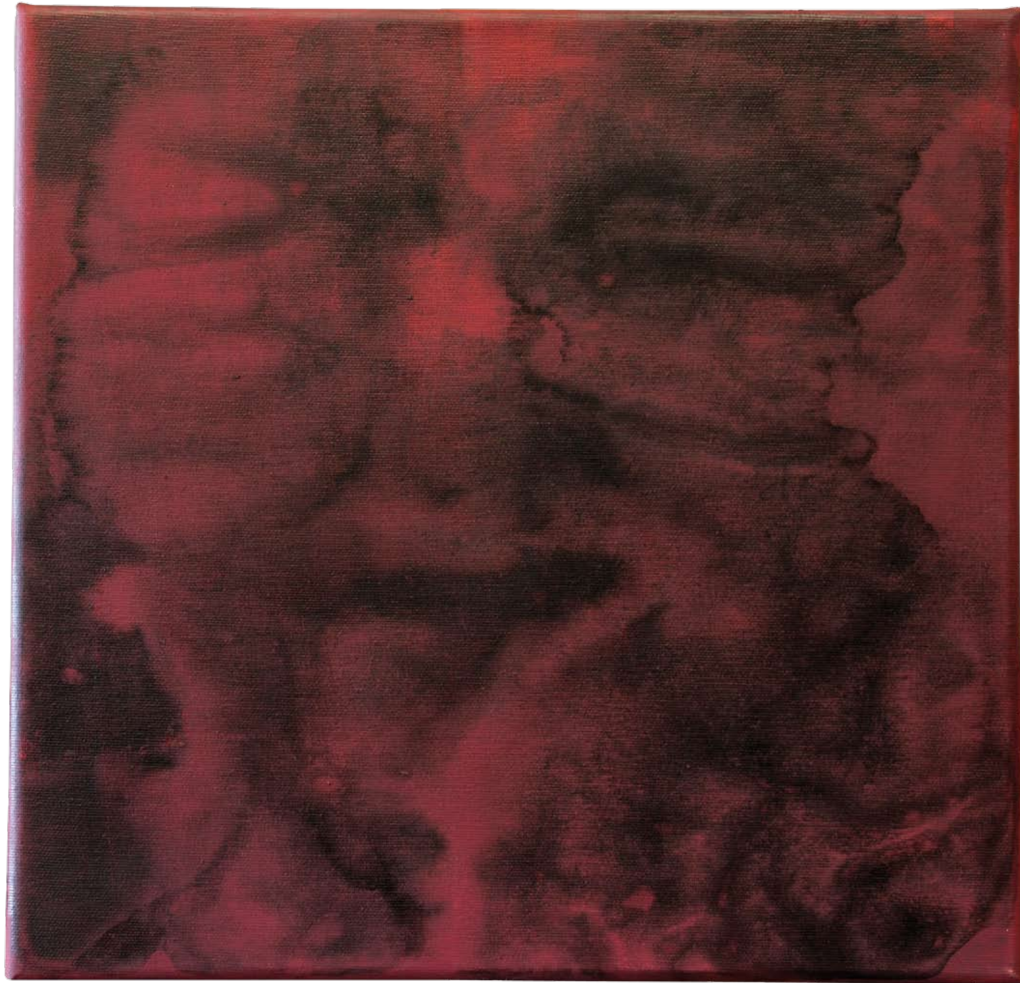
„Nienazwane II” z cyklu „Cialo i sacrum”, 2018, technika mieszana na płótnie, 40 x 40 cm. “Unnamed II” from the cycle “Body and sacrum”, 2018, mixed technique on canvas, 40 x 40 cm