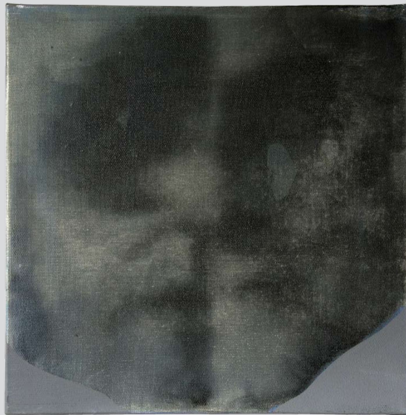
„Nienazwane” z cyklu „Ciało i sacrum”, 2018, technika mieszana na płótnie, 30 x 30 cm. “Unnamed” from the cycle “Body and sacrum”, 2018, mixed technique on canvas, 30 x 30 cm