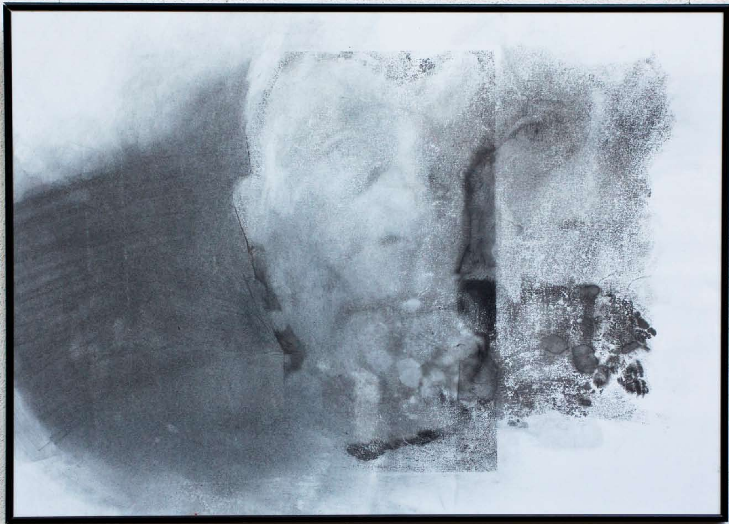
„Bez tytułu” z cyklu „Osobność”, 2017, technika mieszana / rysunek, 50 x 70 cm. “No title” from the cycle “Apartness”, 2017, mixed technique / drawing, 50 x 70 cm.