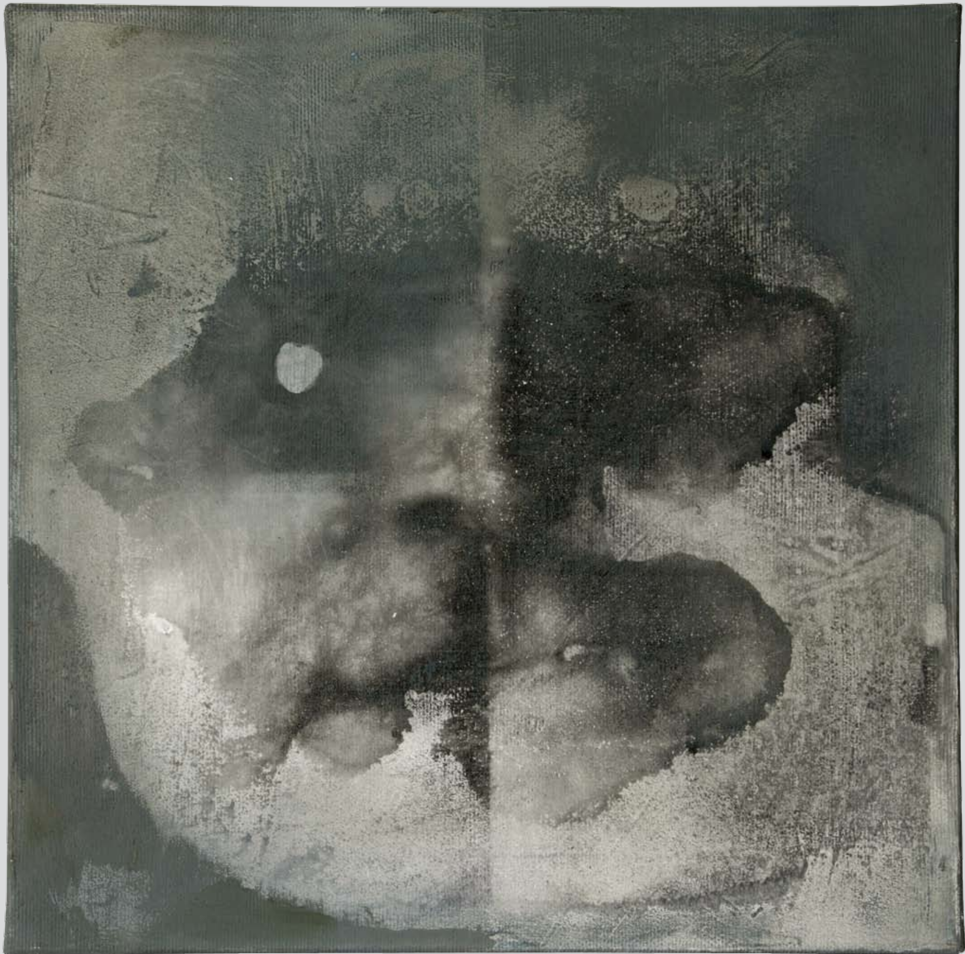
„Nienazwane” z cyklu „Cialo i sacrum”, 2018, technika mieszana na płótnie, 30 x 30 cm. “Unnamed” from the cycle “Body and sacrum”, 2018, mixed technique on canvas, 30 x 30 cm