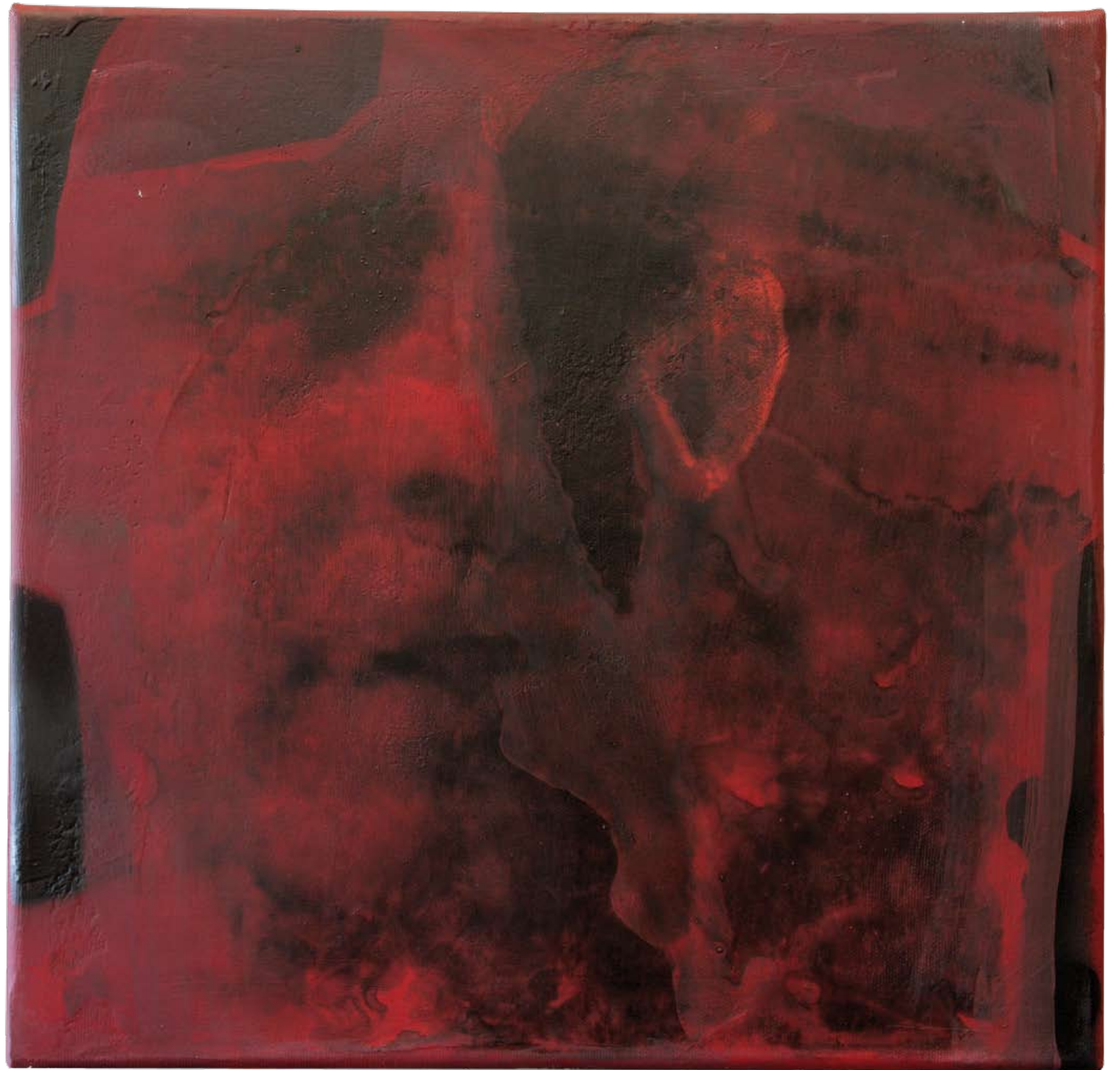
„Nienazwane II” z cyklu „Ciało i sacrum”, 2018, technika mieszana na płótnie, 40 x 40 cm. “Unnamed II” from the cycle “Body and sacrum”, 2018, mixed technique on canvas, 40 x 40 cm