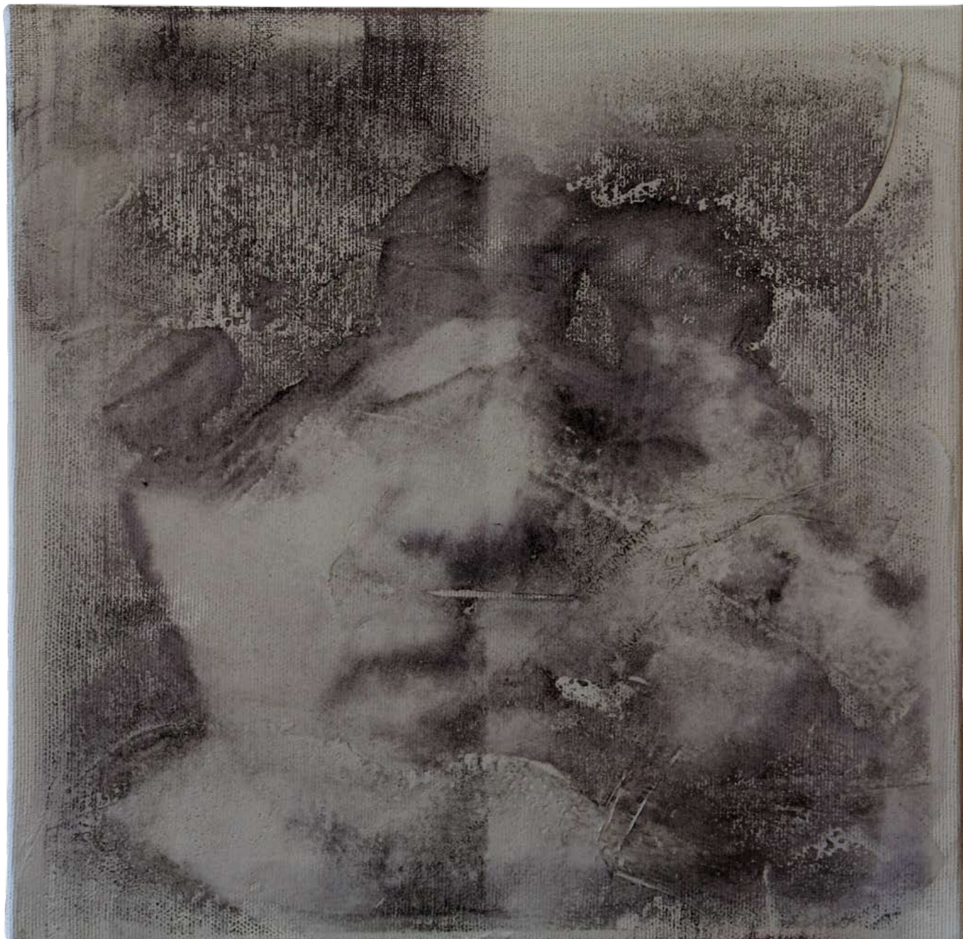
„Nienazwane IV” z cyklu „Cialo i sacrum”, 2018, technika mieszana na płótnie, 30 x 30 cm. “Unnamed IV” from the cycle “Body and sacrum”, 2018, mixed technique on canvas, 30 x 30 cm