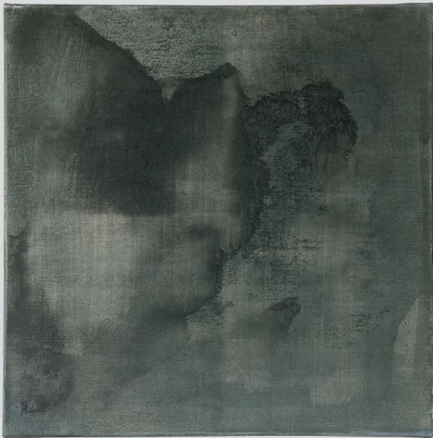
„Nienazwane” z cyklu „Ciało i sacrum”, 2018, technika mieszana na płótnie, 30 x 30 cm. “Unnamed” from the cycle “Body and sacrum”, 2018, mixed technique on canvas, 30 x 30 cm