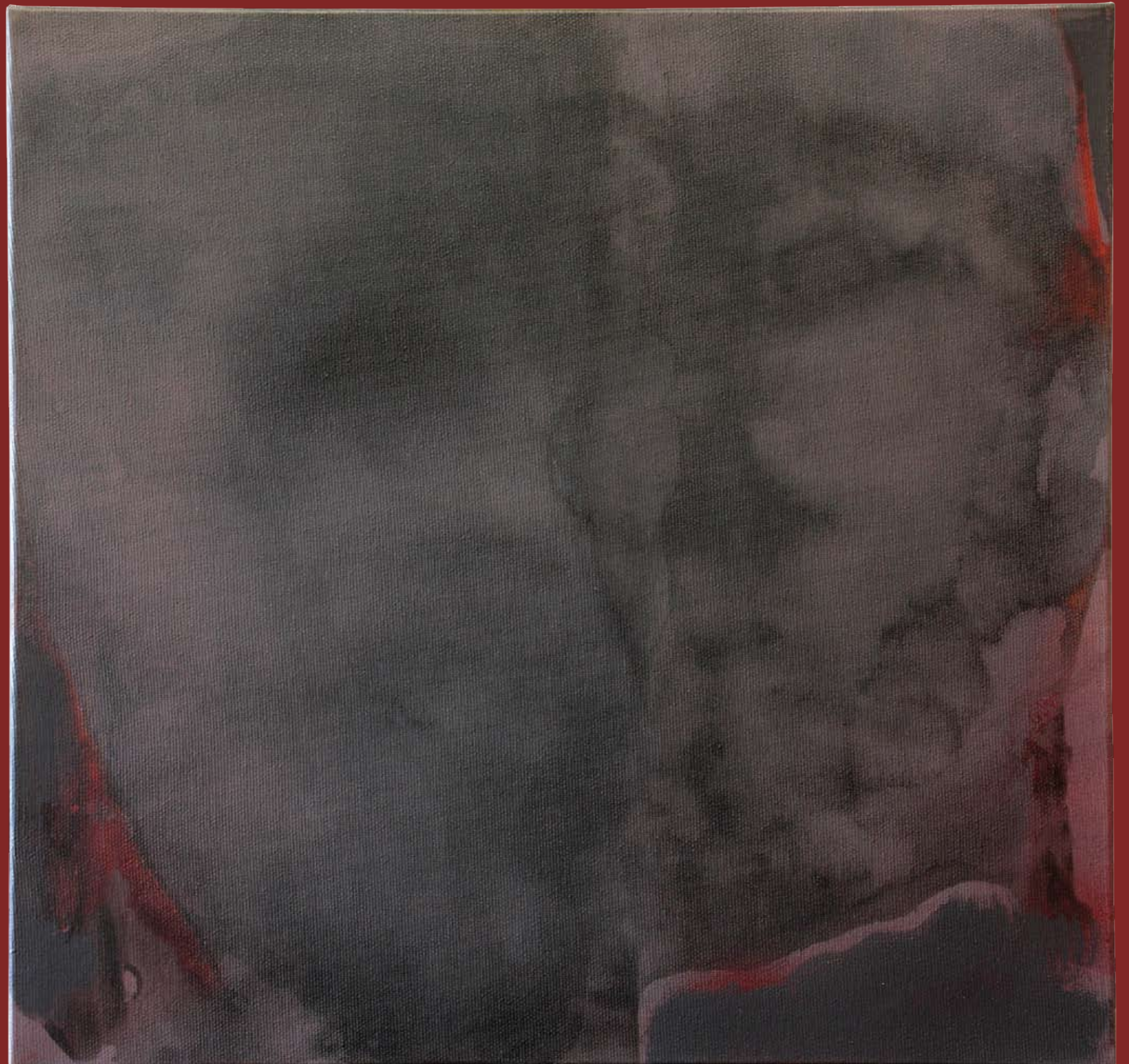
„Nienazwane III” z cyklu „Ciało i sacrum”, 2018, technika mieszana na płótnie, 40 x 40 cm. “Unnamed III” from the cycle “Body and sacrum”, 2018, mixed technique on canvas, 40 x 40 cm