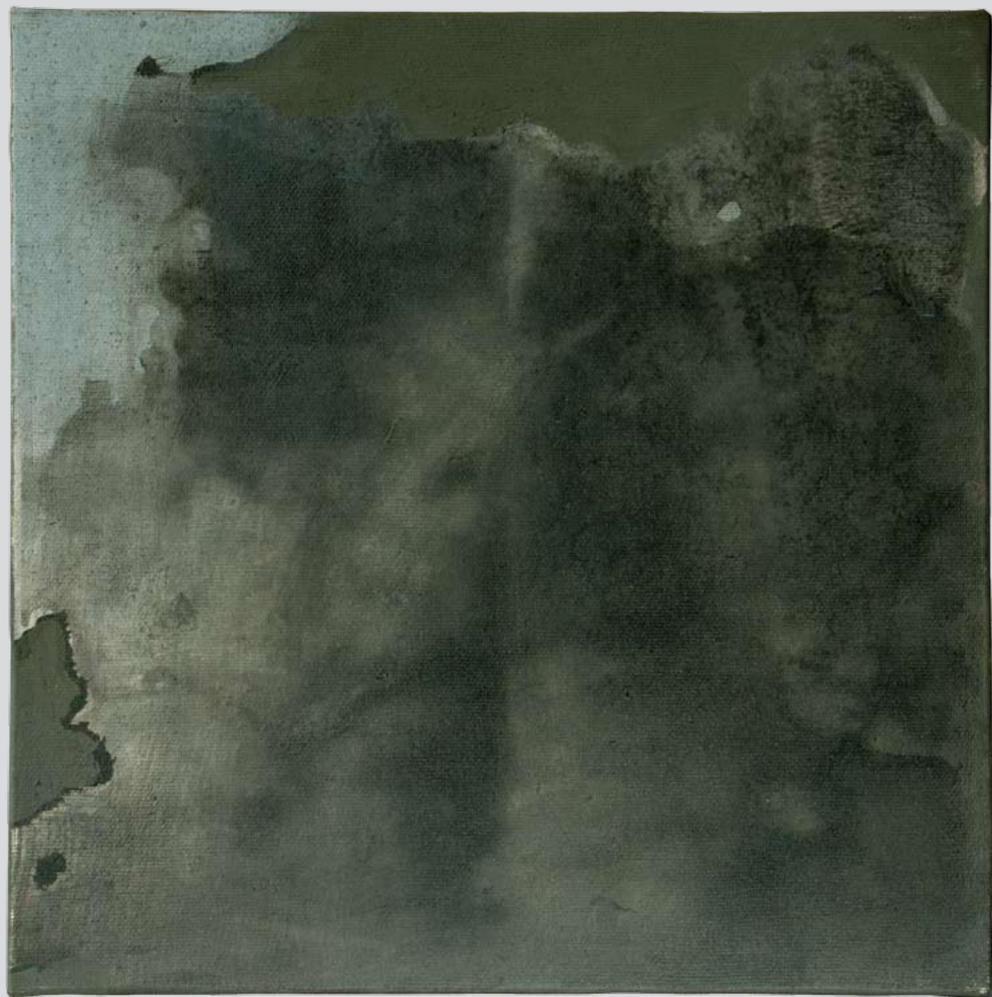
„Nienazwane” z cyklu „Cialo i sacrum”, 2018, technika mieszana na płótnie, 30 x 30 cm. “Unnamed” from the cycle “Body and sacrum”, 2018, mixed technique on canvas, 30 x 30 cm