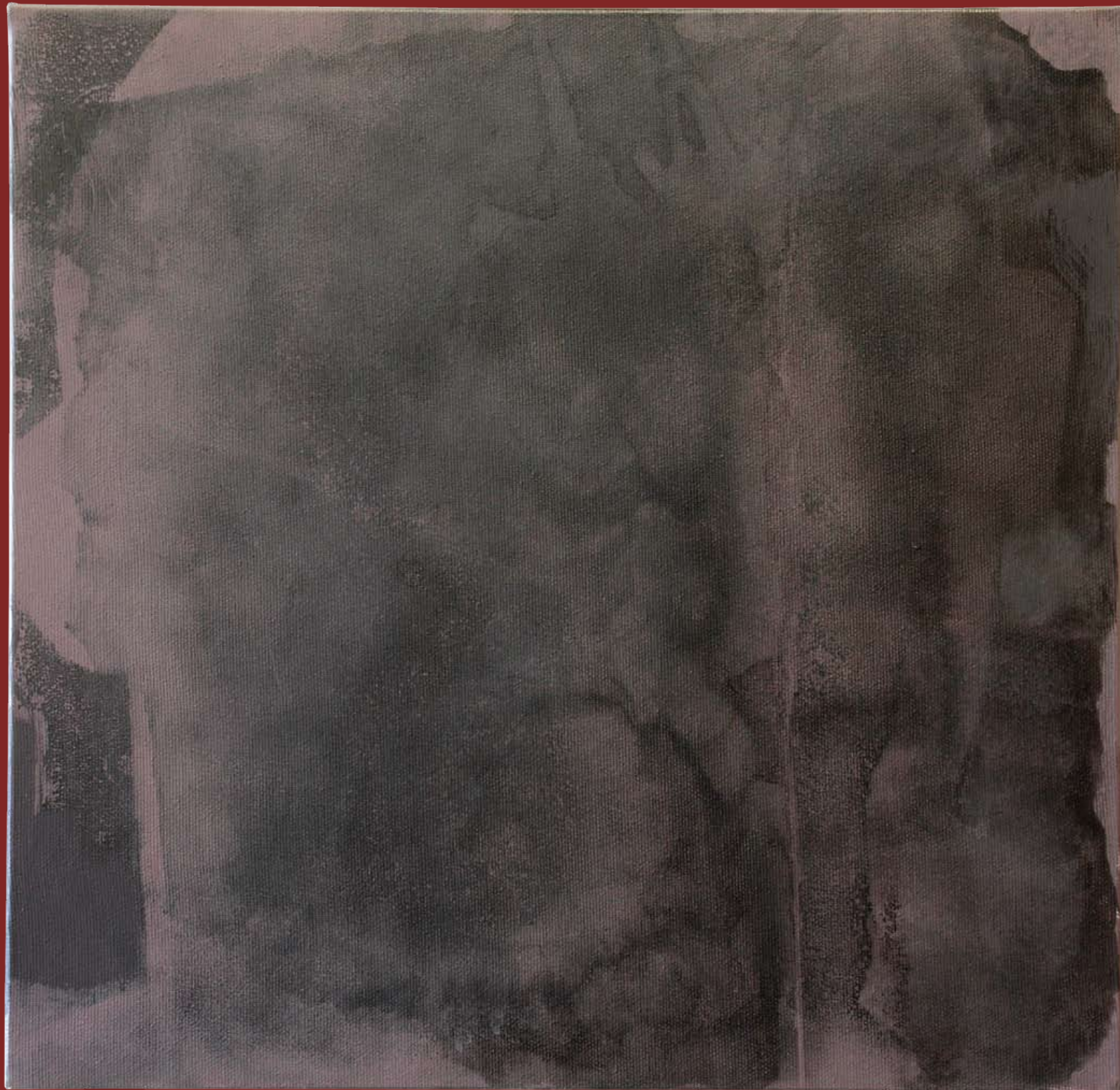
„Nienazwane III” z cyklu „Ciało i sacrum”, 2018, technika mieszana na płótnie, 40 x 40 cm. “Unnamed III” from the cycle “Body and sacrum”, 2018, mixed technique on canvas, 40 x 40 cm