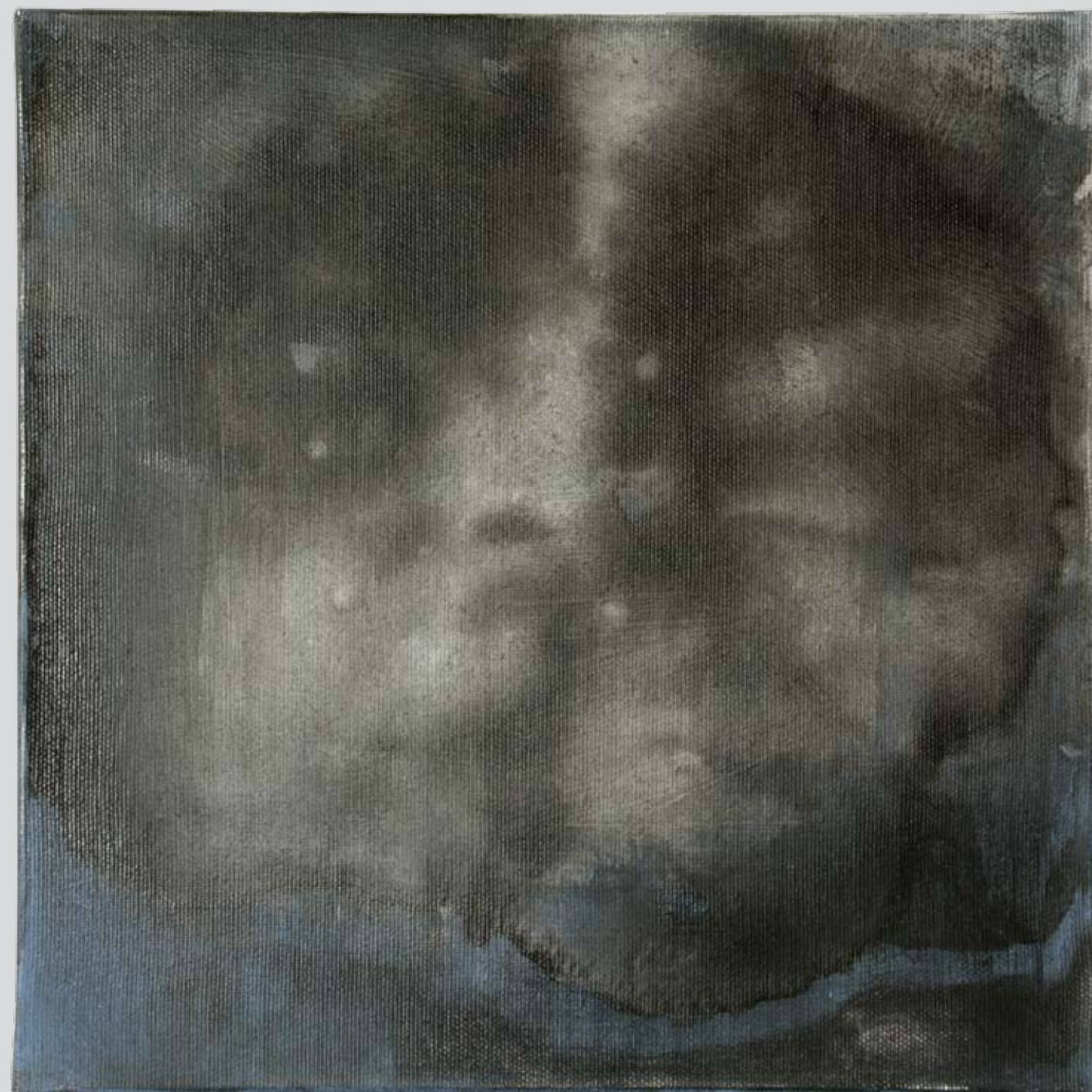
„Nienazwane” z cyklu „Cialo i sacrum”, 2018, technika mieszana na płótnie, 30 x 30 cm. “Unnamed” from the cycle “Body and sacrum”, 2018, mixed technique on canvas, 30 x 30 cm