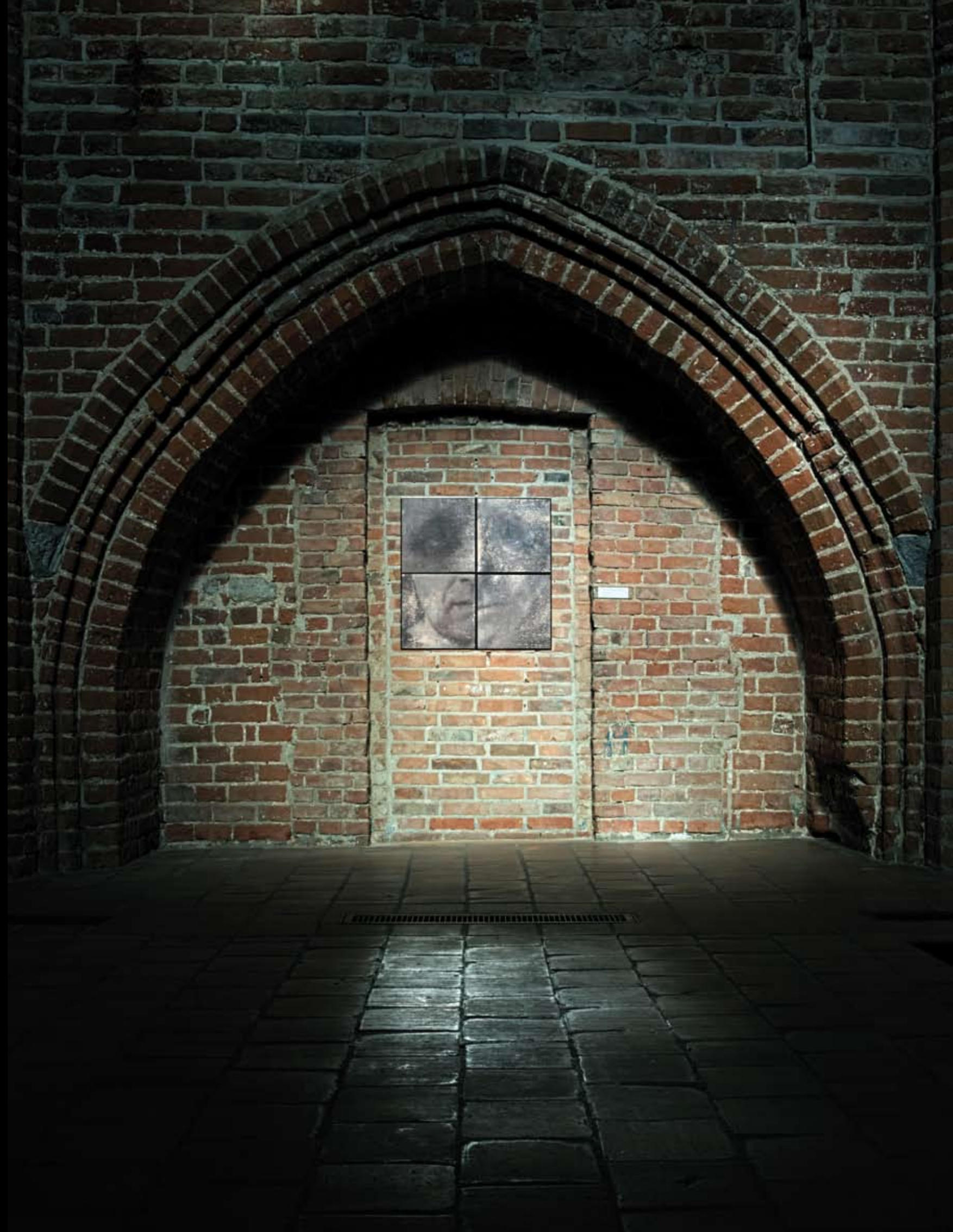
„Kwadroptyk III” z cyklu „OUTSIDER”, 2018, technika mieszana / grafika, 4 x 40 cm x 40 cm. ▶ “Quadriptych III” from the cycle “OUTSIDER”, 2018, mixed technique / graphics, 4 x 40 cm x 40 cm