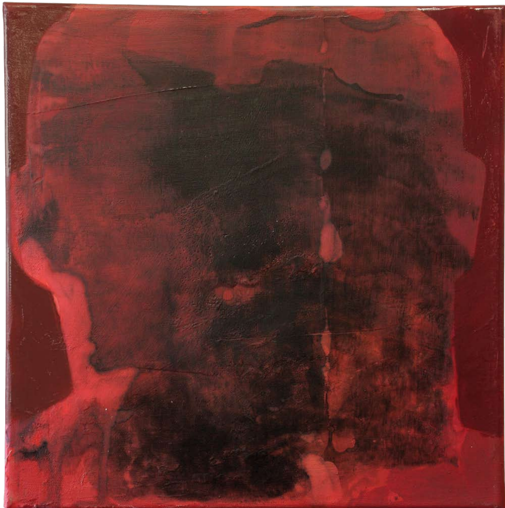
„Nienazwane II” z cyklu „Cialo i sacrum”, 2018, technika mieszana na płótnie, 40 x 40 cm. “Unnamed II” from the cycle “Body and sacrum”, 2018, mixed technique on canvas, 40 x 40 cm