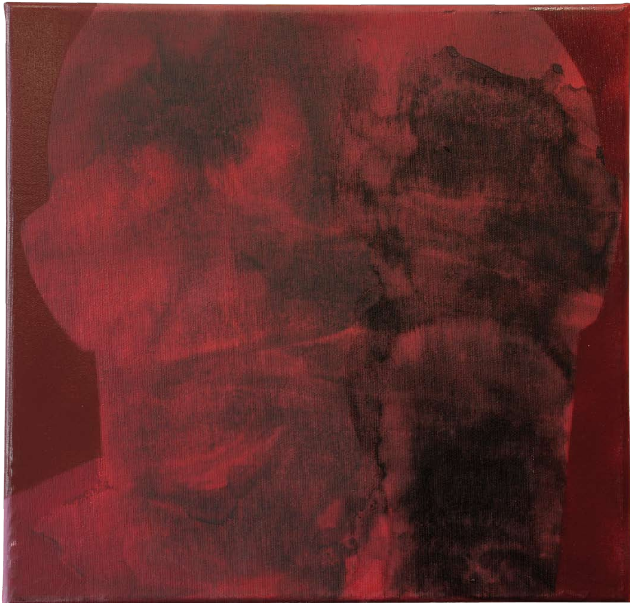
„Nienazwane II” z cyklu „Ciało i sacrum”, 2018, technika mieszana na płótnie, 40 x 40 cm. “Unnamed II” from the cycle “Body and sacrum”, 2018, mixed technique on canvas, 40 x 40 cm