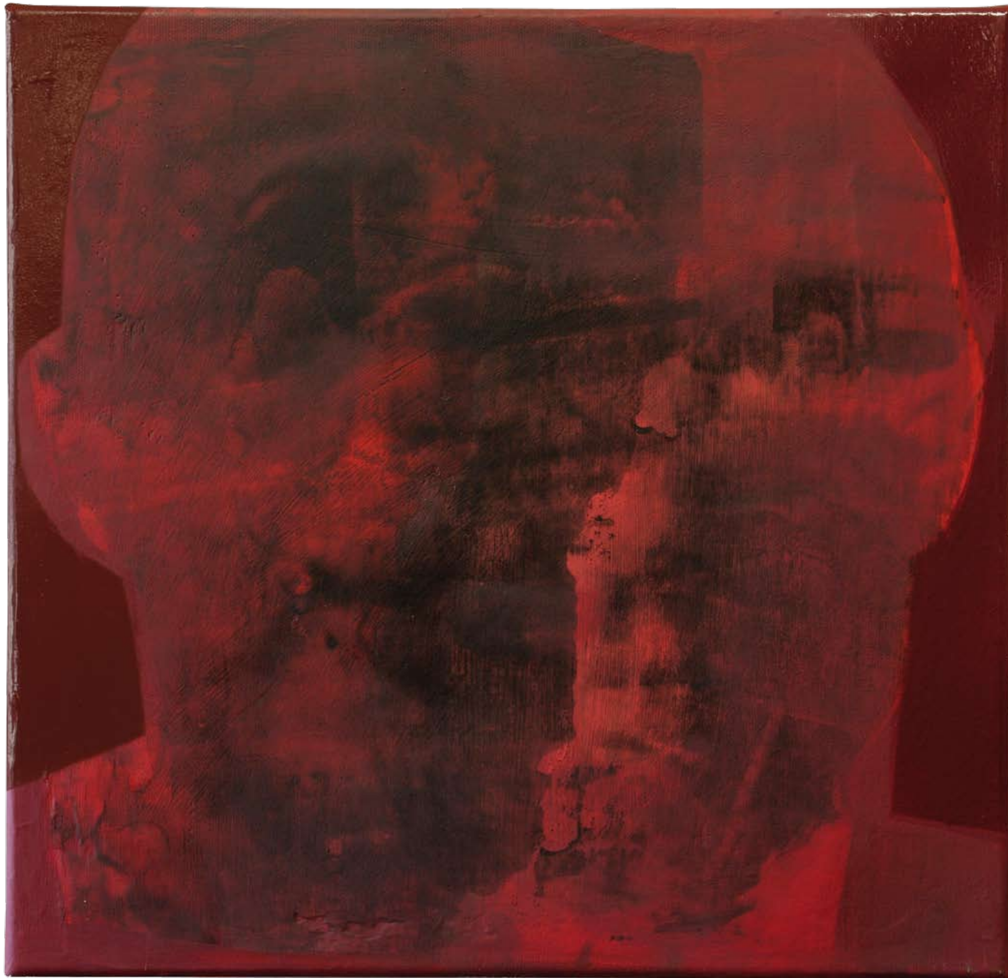
„Nienazwane II” z cyklu „Cialo i sacrum”, 2018, technika mieszana na płótnie, 40 x 40 cm. “Unnamed II” from the cycle “Body and sacrum”, 2018, mixed technique on canvas, 40 x 40 cm