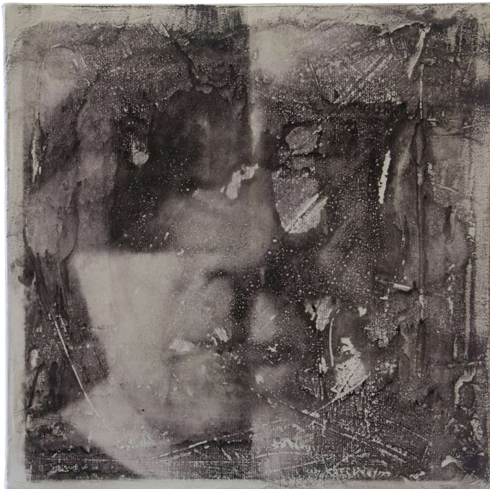
„Nienazwane IV” z cyklu „Ciało i sacrum”, 2018, technika mieszana na płótnie, 30 x 30 cm. “Unnamed IV” from the cycle “Body and sacrum”, 2018, mixed technique on canvas, 30 x 30 cm