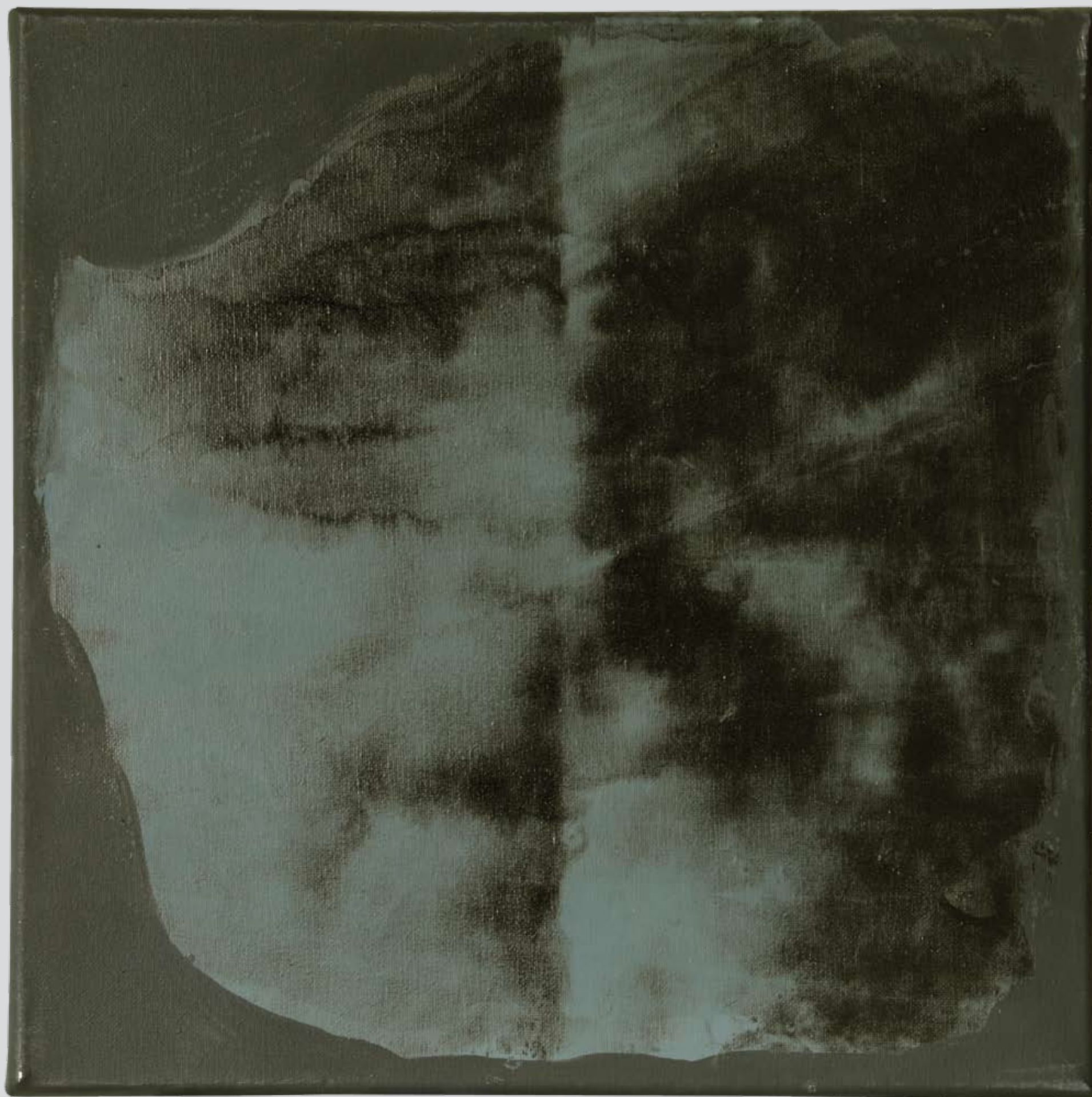
„Nienazwane” z cyklu „Cialo i sacrum”, 2018, technika mieszana na płótnie, 30 x 30 cm. “Unnamed” from the cycle “Body and sacrum”, 2018, mixed technique on canvas, 30 x 30 cm