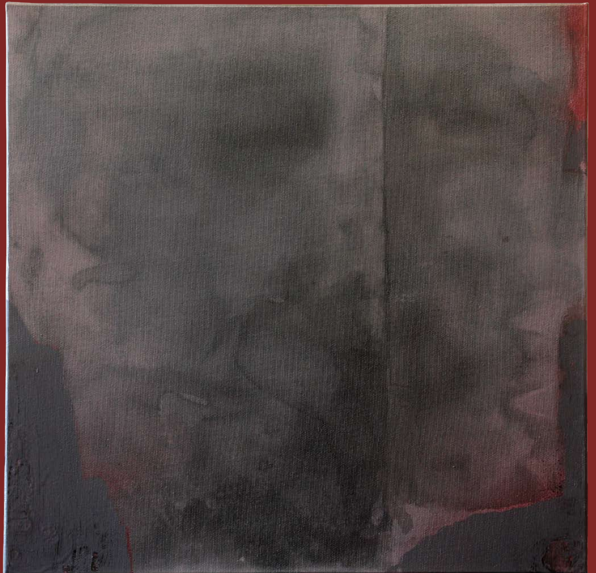
„Nienazwane III” z cyklu „Cialo i sacrum”, 2018, technika mieszana na płótnie, 40 x 40 cm. “Unnamed III” from the cycle “Body and sacrum”, 2018, mixed technique on canvas, 40 x 40 cm