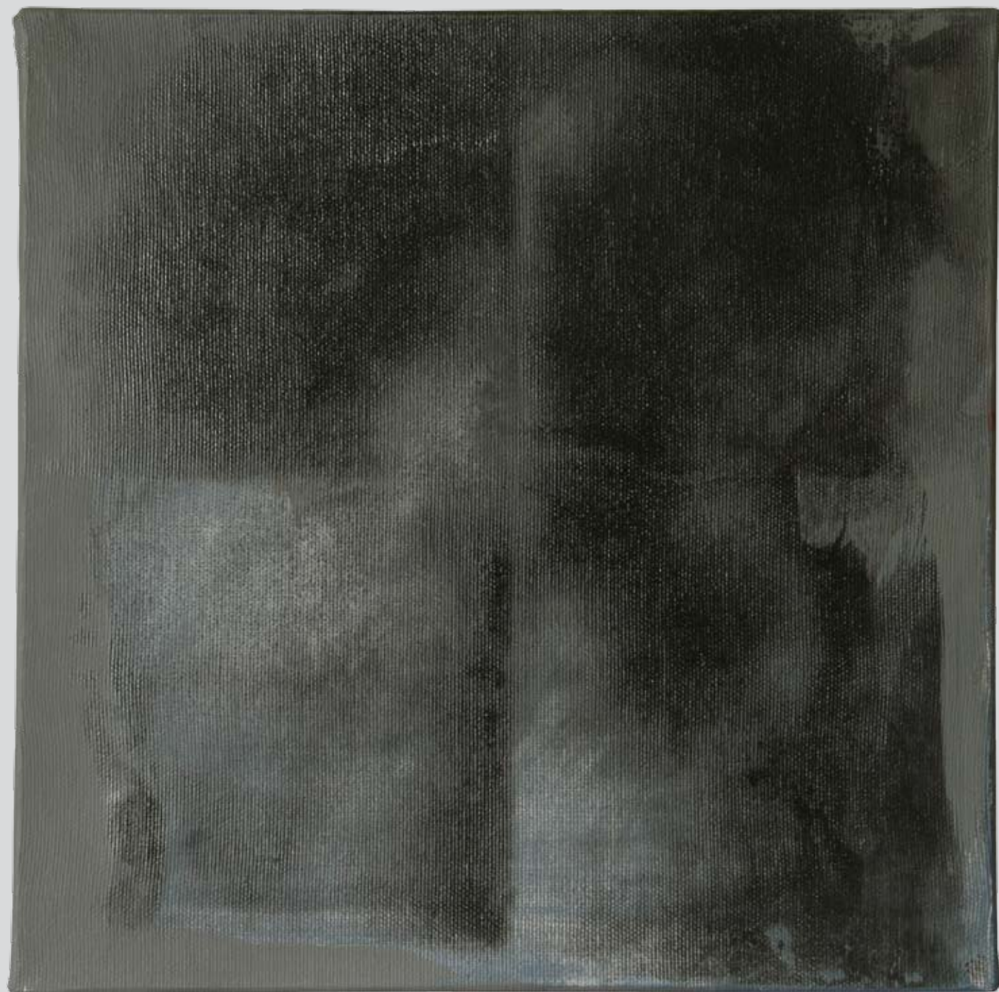
„Nienazwane” z cyklu „Ciało i sacrum”, 2018, technika mieszana na płótnie, 30 x 30 cm. “Unnamed” from the cycle “Body and sacrum”, 2018, mixed technique on canvas, 30 x 30 cm