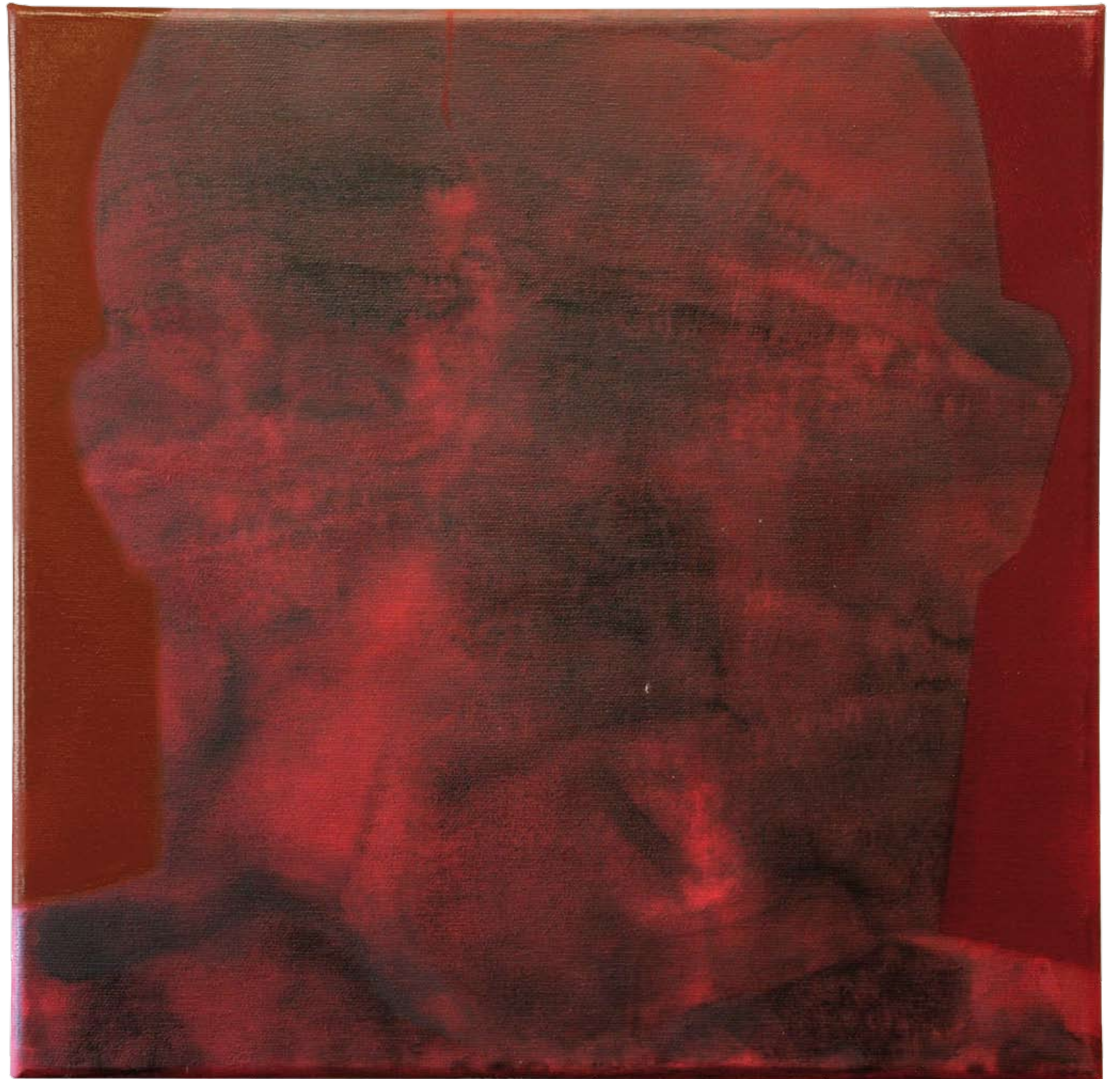
„Nienazwane II” z cyklu „Cialo i sacrum”, 2018, technika mieszana na płótnie, 40 x 40 cm. “Unnamed II” from the cycle “Body and sacrum”, 2018, mixed technique on canvas, 40 x 40 cm