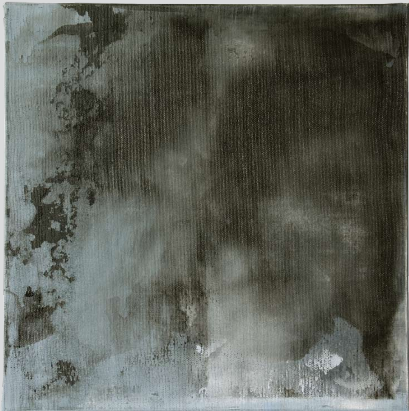
„Nienazwane” z cyklu „Cialo i sacrum”, 2018, technika mieszana na płótnie, 30 x 30 cm. “Unnamed” from the cycle “Body and sacrum”, 2018, mixed technique on canvas, 30 x 30 cm