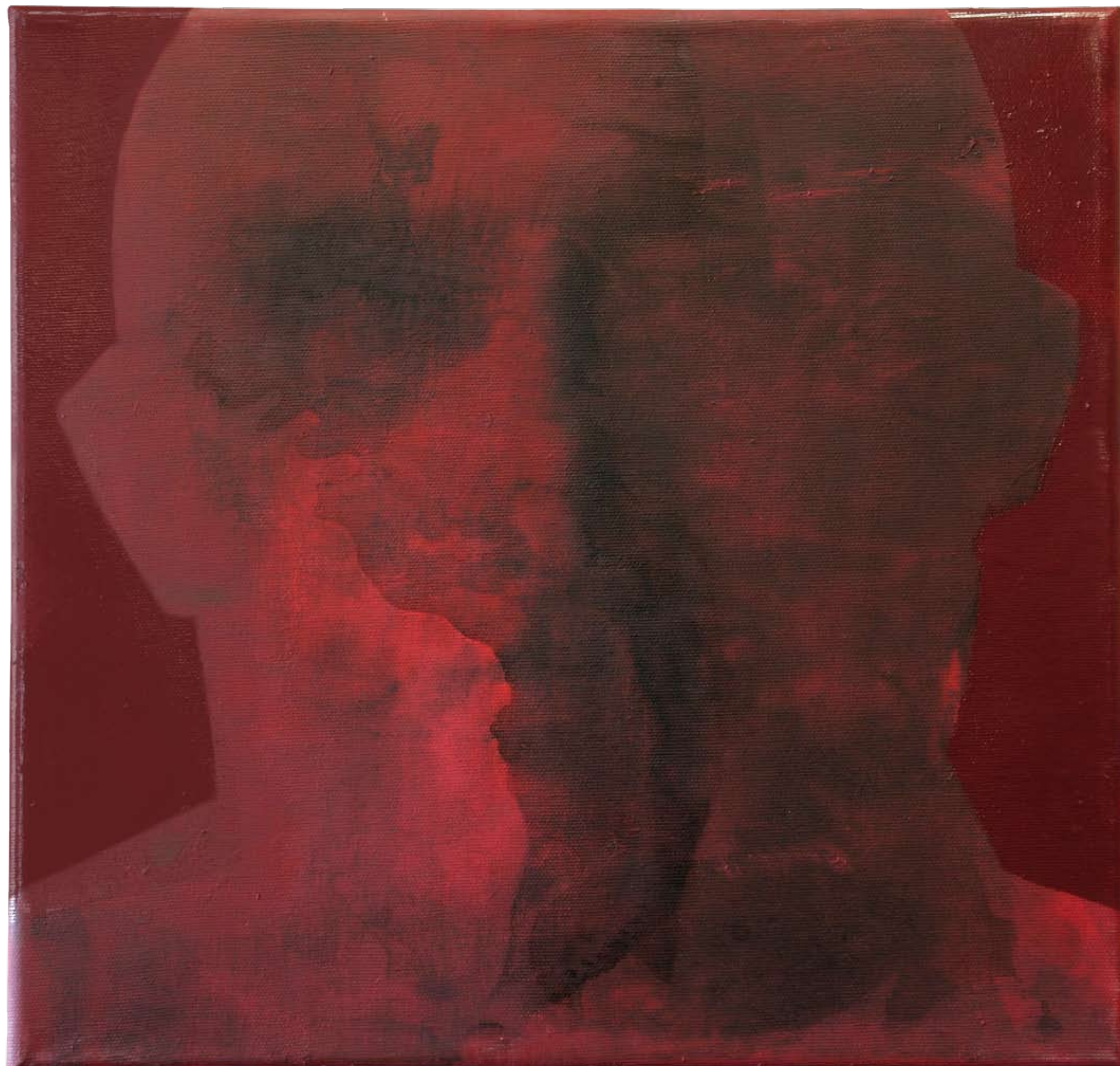
„Nienazwane II” z cyklu „Ciało i sacrum”, 2018, technika mieszana na płótnie, 40 x 40 cm. “Unnamed II” from the cycle “Body and sacrum”, 2018, mixed technique on canvas, 40 x 40 cm