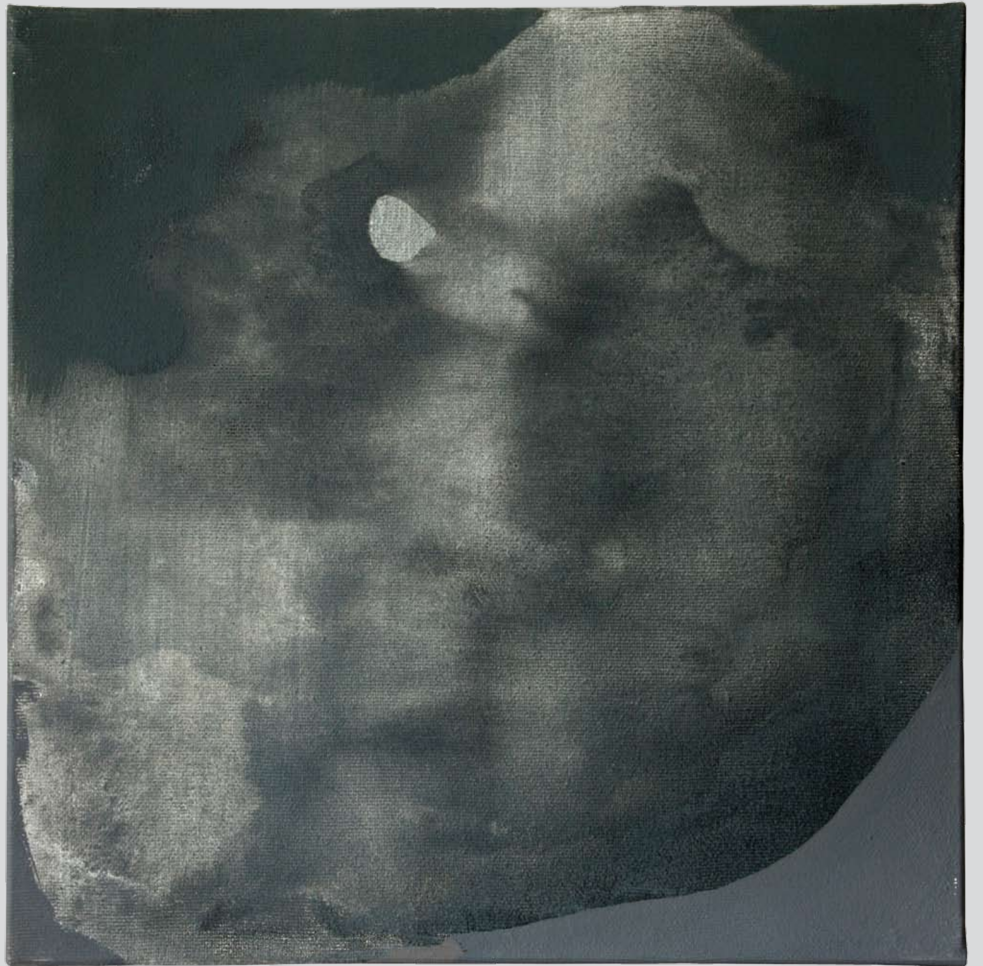
„Nienazwane” z cyklu „Ciało i sacrum”, 2018, technika mieszana na płótnie, 30 x 30 cm. “Unnamed” from the cycle “Body and sacrum”, 2018, mixed technique on canvas, 30 x 30 cm